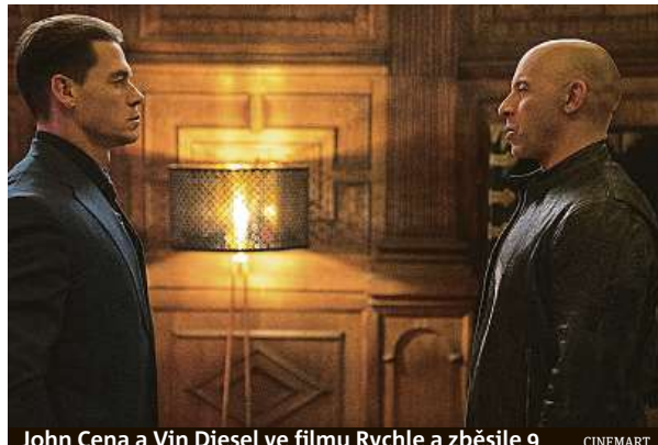
John Cena a Vin Diesel ve filmu Rychle a zběsile 9

Hned první den v pondělí v menších kinech, která