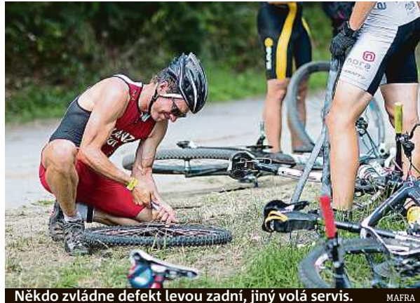
Někdo zvládne defekt levou zadní, jiný volá servis.

Čím dál tím dokonalejší stroje, přístroje, vybavení domácnosti, auta nebo věci pro sport a zábavu z nás dělají „nešikovné“ bytosti. Pro mnohé je však i zatlučení hřebíku problém.