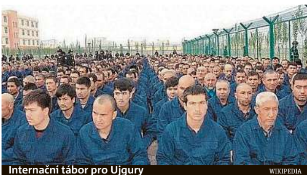
Internáční tábor pro Ujgury WIKIPEDIA

Čínský programátor nyní ukázal televizi BBC fotografii pěti Ujgurů, na kterých čínské úřady údajně nový systém zkoušely. „Čínská vláda využívá Ujgury jako pokusné subjekty pro různé experimenty způsobu, jakými jsou využívány myši v laboratořích,“ řekl. „Umístili jsme kamery tři metry od subjektů,“ řekl o projektu, který pomáhal instalovat.