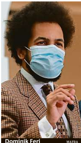
Dominik Feri

Feri v úterý oznámil rezignaci na poslanecký mandát poté, co ho několik žen v médiích obvinilo ze sexuálního obtěžování a násilí. „Prošetřování události provede pražské krajské ředitelství, konkrétně oddělení obecné kriminality Prahy 1,“ sdělila policie. Feri měl v říjnových sněmovních volbách figurovat