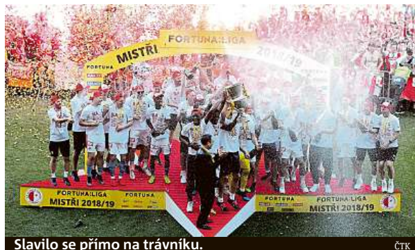
Slavilo se přímo na trávníku.

Spartanští fandové slávistický večírek bojkotovali.