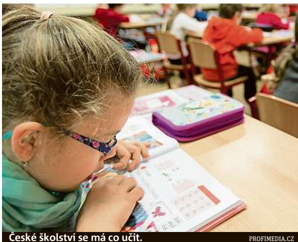
České školství se má co učit.

Čeští školáci si užijí méně volných dní než jejich vrstevníci z jiných evropských zemí. V českých školách probíhala výuka v posledním školním roce během 196 dnů. Častěji už musí do školy jen děti v Itálii (200 dní), Dánsku (200) a Německu (až 208). Analýza projektu Evropa v datech ukazuje, že nastavení povinné škol-