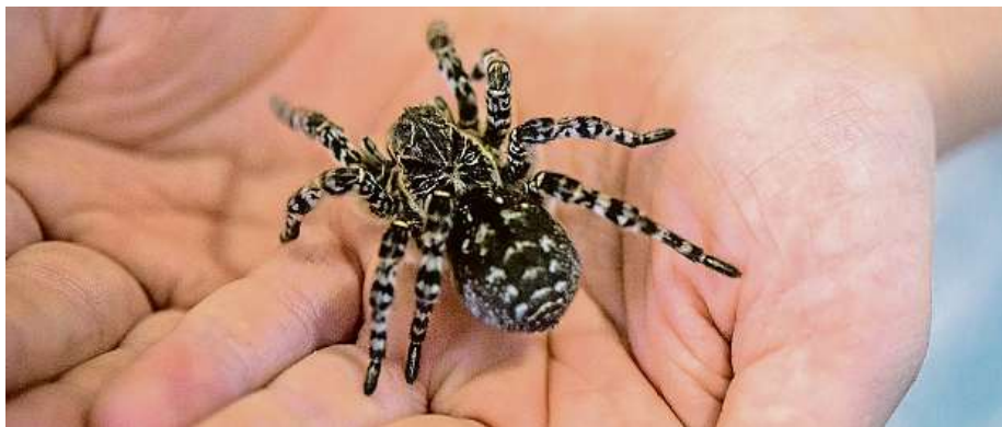
Když se připočte délka nohou, je pavouk velký kolem sedmi centimetrů.

Přes svou velikost není tento pavouk podle arachnologa Huly nebezpečný. Lidskou kůži by prokousl jen s velkými obtížemi. Lidé v zoo v Troji, která první návštěvníky přivítala 28. září 1931, v dnešní době najdou více než 150 expozic. ČTK