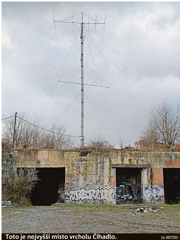
Toto je nejvyšší místo vrcholu Čihadlo.

Tolik metrů nad zemí má nejvyšší místo nejvyšší pražské budovy City Tower na Pankráci. Budova byla původně stavěna pro Český rozhlas, ale ten ji v roce 1993 odmítl.