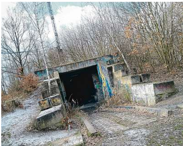
Ještě v devadesátých letech na vrchu Čihadlo rezavěly protiletadlové raketové komplety S-125 NÉVA. Takto to tu vypadá teď.

„Plánovaná rozhledna by měla sloužit jak obyvatelům městské části, tak i jejím návštěvníkům. Jejím umístě-