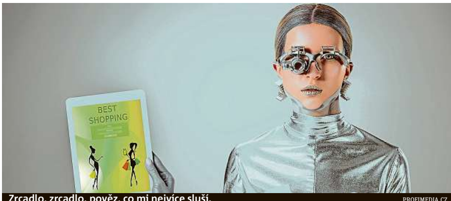
Zrcadlo, zrcadlo, pověz, co mi nejvíce sluší.

Dalším zajímavým inovátorem je americký prodejce Sam's Club, jenž vyvinul aplikaci, která využívá strojové učení a data o předchozích nákupech zákazníků, čímž