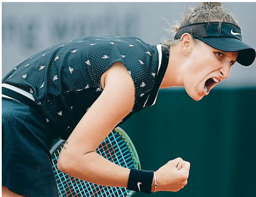
Vondroušová je označována za černého koně turnaje.