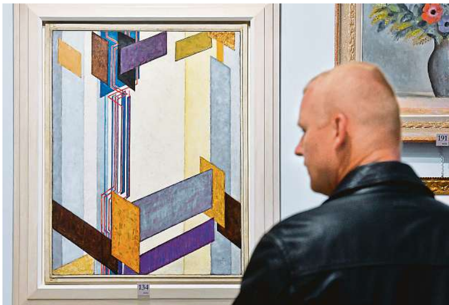
Za obraz Plochy příčné II kupec zaplatí 78 milionů korun.

Druhou nejdražší prodanou položkou je práce Jakuba Schikanedera Mlékařka vydražená za 19,5 milionu korun (vyvolávací cena byla čtyři miliony), jež je považovaná za objev posledního desetiletí na českém trhu s uměním. ČTK