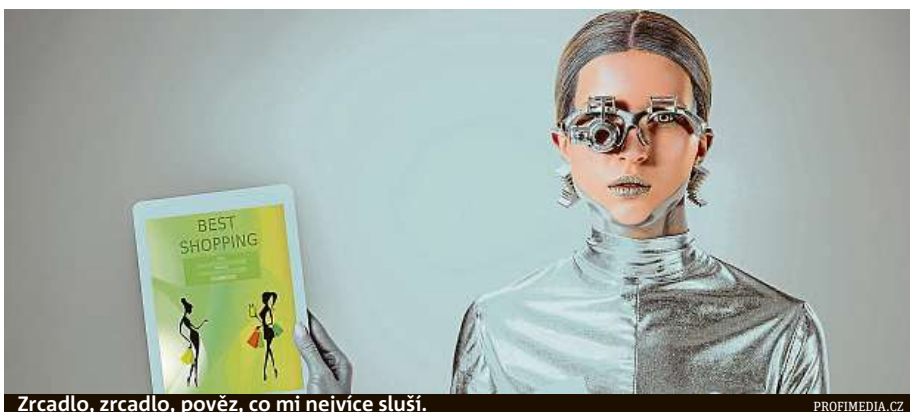
Zrcadlo, zrcadlo, pověz, co mi nejvíce sluší.

Dalším zajímavým inovátorem je americký prodejce Sam's Club, jenž vyvinul aplikaci, která využívá strojové učení a data o předchozích nákupech zákazníků, čímž