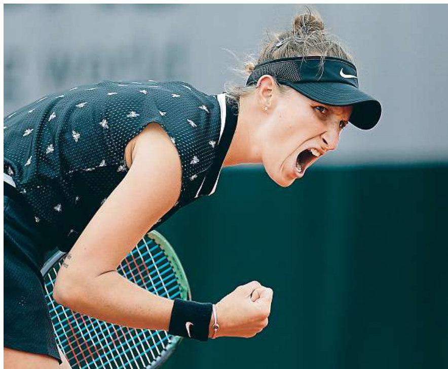
Česká tenistka Markéta Vondroušová slaví letošní 23. vítězství.