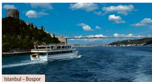
Istanbul – Bosporu