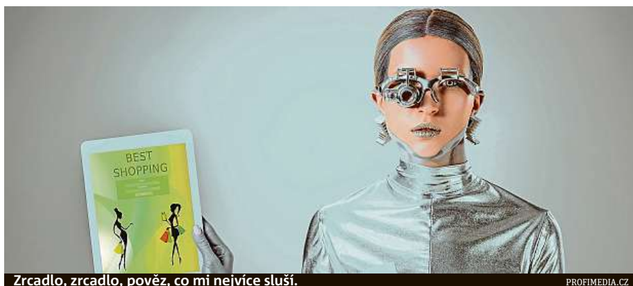
Zrcadlo, zrcadlo, pověz, co mi nejvíce sluší.

Dalším zajímavým inovátorem je americký prodejce Sam's Club, jenž vyvinul aplikaci, která využívá strojové učení a data o předchozích nákupech zákazníků, čímž