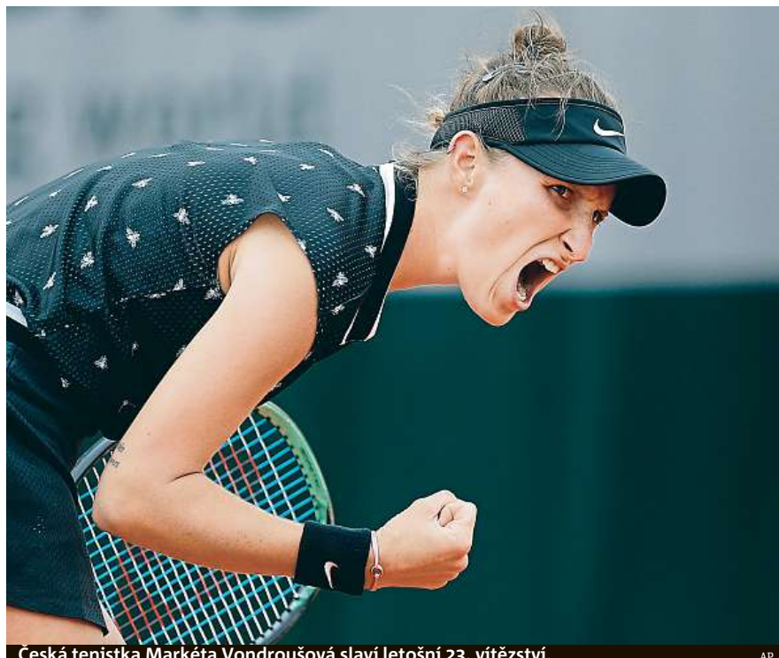
Česká tenistka Markéta Vondroušová slaví letošní 23. vítězství.