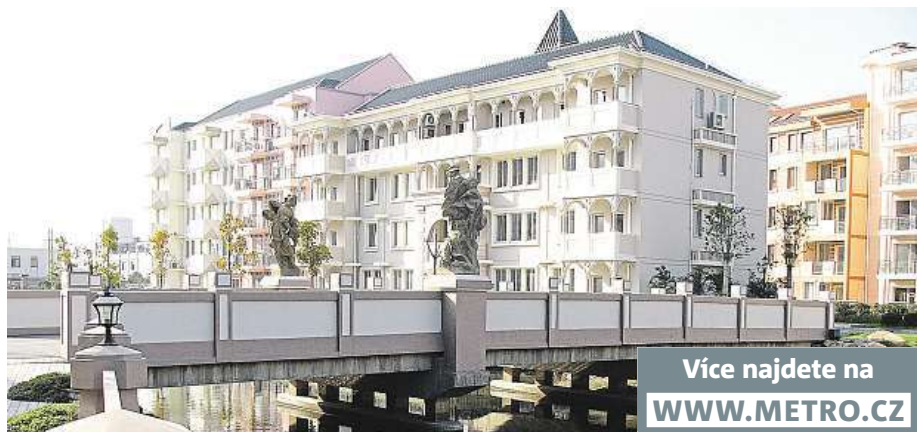
V Šanghaji najdete fasády inspirované kubismem, renesancí, secesí i barokem.