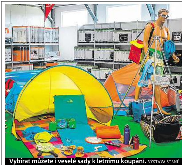
Vybírat můžete i veselé sady k letnímu koupání. VÝSTAVA STANŮ

„Vycházíme vstřícně poptávce. Nabízíme proto solární na-