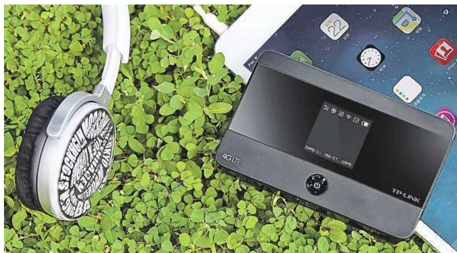
Připojit se můžete vlastně kdekoli přes jakékoliv zařízení.

Nejrychlejší mobilní LTE internet nás obklopuje na každém kroku. Po výrazné modernizaci a rozšíření datových sítí už se k LTE připojíme i v menších městech a vesnicích.