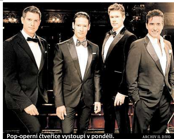
Pop-operní čtveřice vystoupí v pondělí.

Když jsme se na škole učili Prodanou nevěstu, bylo to mučení. Je to opravdu těžké, ale i tehdy jsem se snažil zjis-