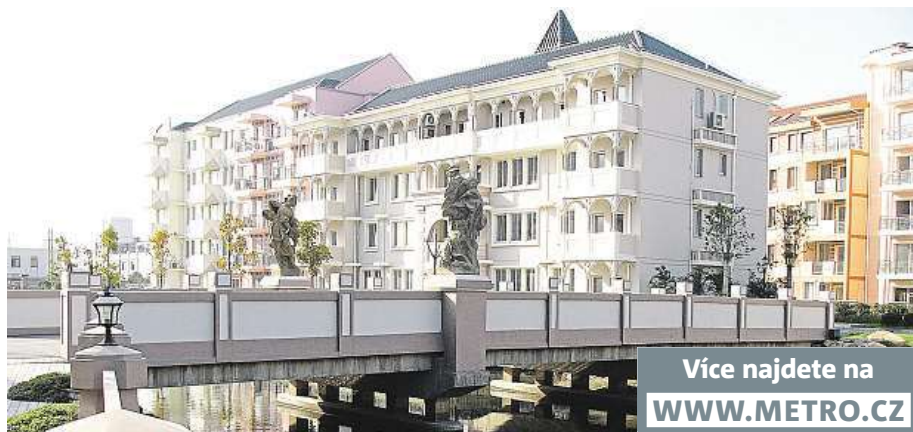
V Šanghaji najdete fasády inspirované kubismem, renesancí, secesí i barokem.