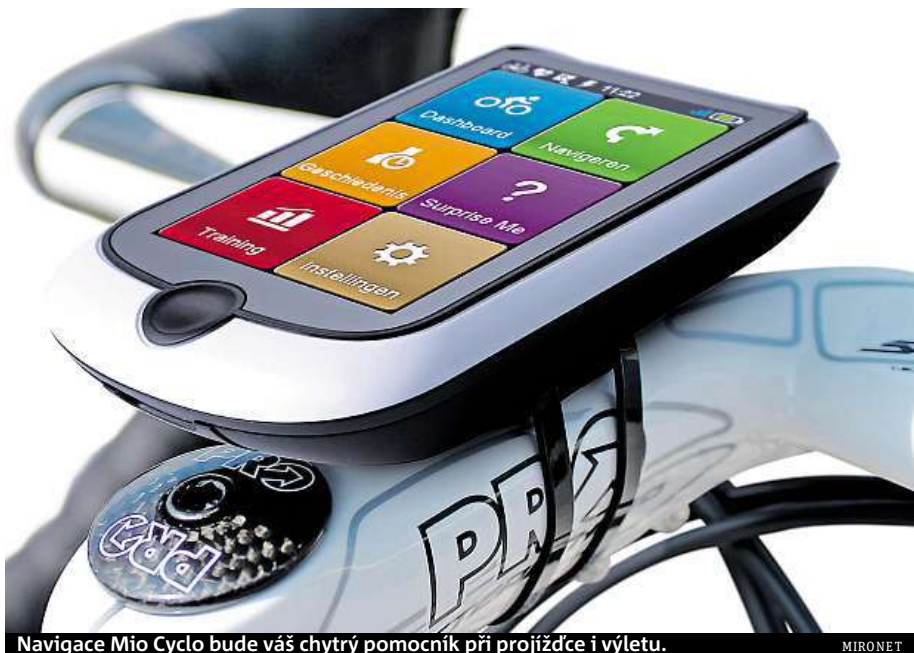
Navigace Mio Cyclo bude váš chytrý pomocník při projížďce i výletu.

Mezi nejvyššími cyklistické navigace patří ty od společnosti Mio. Produktová řada Mio Cyclo uspokojí nároky