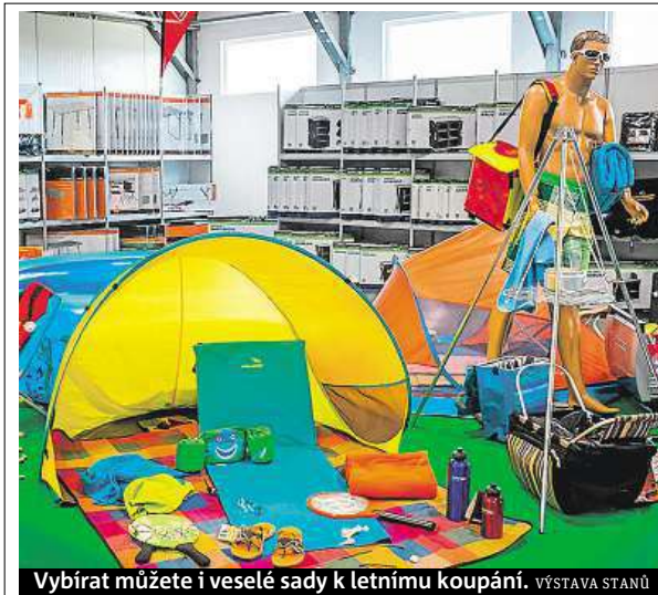
Vybírat můžete i veselé sady k letnímu koupání. VÝSTAVA STANŮ

„Vycházíme vstřícně poptávce. Nabízíme proto solární na-