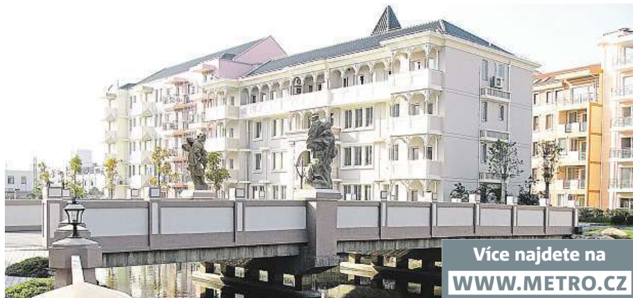
V Šanghaji najdete fasády inspirované kubismem, renesancí, secesí i barokem.