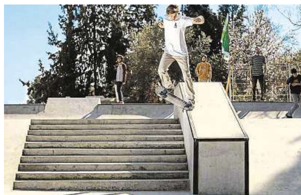
Skejty a graffiti v Jeruzalémě (Nevo vpravo nahoře)