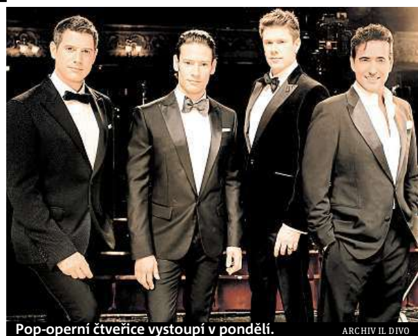
Pop-operní čtveřice vystoupí v pondělí.

Když jsme se na škole učili Prodanou nevěstu, bylo to mučení. Je to opravdu těžké, ale i tehdy jsem se snažil zjis-