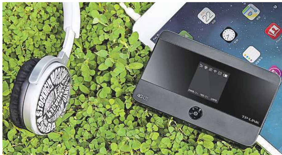
Připojit se můžete vlastně kdekoli přes jakékoliv zařízení.

Nejrychlejší mobilní LTE internet nás obklopuje na každém kroku. Po výrazné modernizaci a rozšíření datových sítí už se k LTE připojíme i v menších městech a vesnicích.