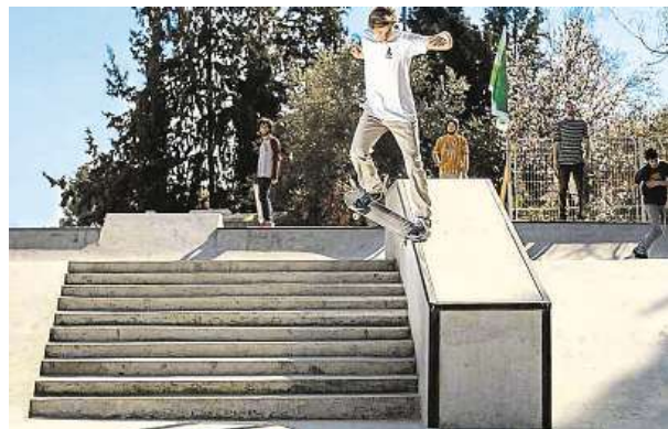
Skejty a graffiti v Jeruzalémě (Nevo vpravo nahoře)