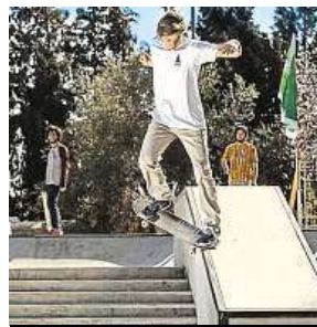
Skejty v Jeruzalémě (Nevo vpravo)

Jen minimální. Potřebovali bychom pomoc, pochopitelně i po finanční stránce. Dří-