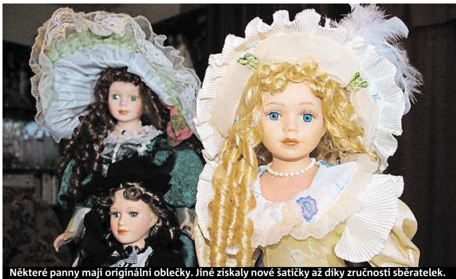
Některé panny mají originální oblečky. Jiné získaly nové šatičky až díky zručnosti sběratelek.