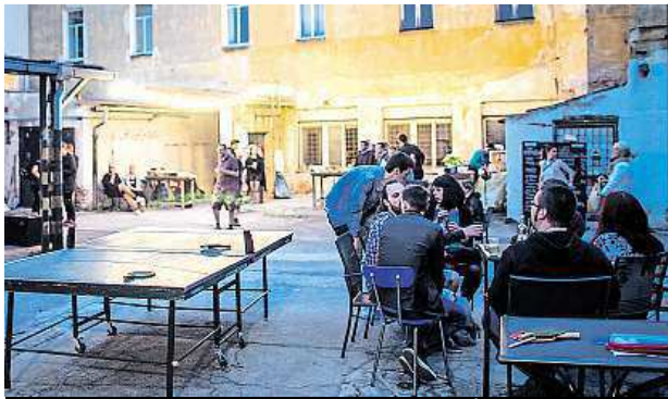
Nový kulturní objekt nabídne i posezení a různé aktivity na dvoru budovy.