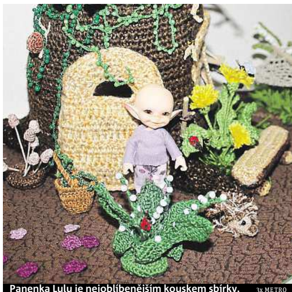
Panenko Lulu je nejoblíbenějším kouskem sbírky.