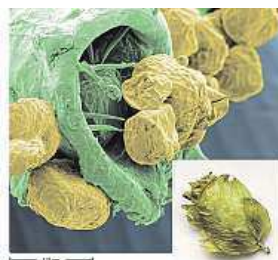
Sušený chmel Sládek zvětšeno 75x