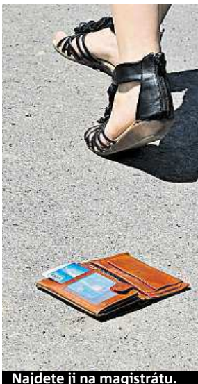
Najdete ji na magistrátu.

Aktuálně je ve skladu magistrátu několik tisíc věcí od dokladů až po klíče od auta. Mezi přinesenými věcmi magistrát skladuje i několik kuriozit. „Ve skladu máme i kusy nábytku, jednou jsme tu měli míchačku nebo staré pneumatiky,“ říká mluvčí Magistrátu města Brna Pavel Žára. Pro mnoho věcí podobného typu si většina lidí už nepřijde. Místo ve ztrátách a nálezech má na magistrátu každá věc půl roku. „Po této době posíláme věci do skladu do Vyškova. Po třech letech pak část nevyzvednutých