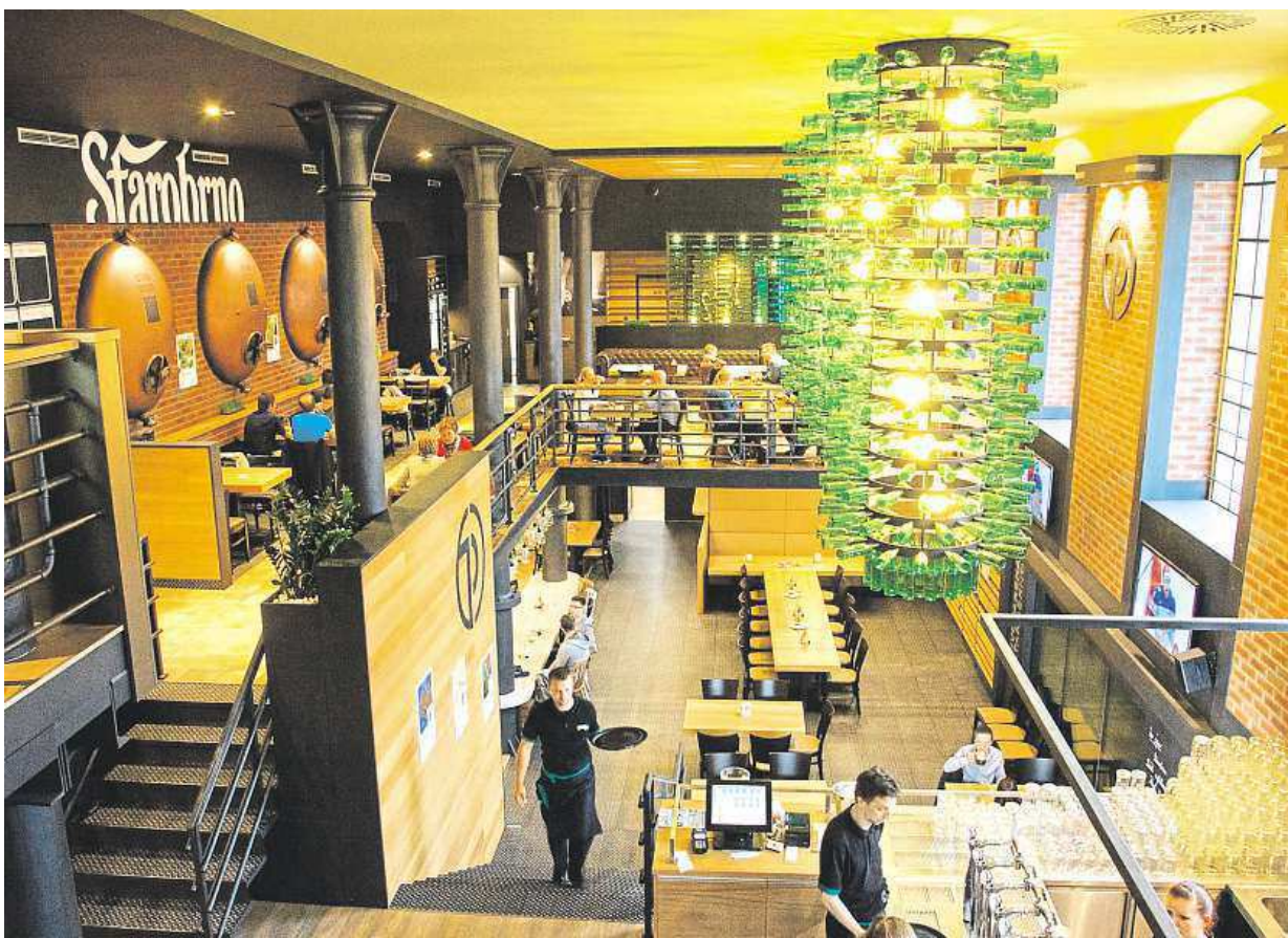
Až do konce června si hosté Pivovarské restaurace mohou u piva prohlédnout unikátní sérii snímků o zlatavém moku.

Pivovarská restaurace v květnu kromě výstavy spustila také gastronomický koncept Beer and Food, který předvádí netradiční skloubení surovin pro výrobu piva a jídla. Nyní projekt běží formou menu na objednávku, kdy Starobrnno Pivovarská restaurace nabízí výběr ze čtyř verzí s výkladem pivního sommeliéra. „V červenci bude pro hosty připraven zcela nový jídelní lístek, kde se představí nové recepty specialit studené i teplé kuchyně. Lákadlem v letních měsících bude třeba i pivní zmrzlina,“ říká provozovatel Starobrnno