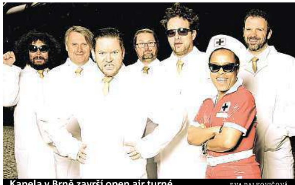
Kapela v Brně završí open air turné.