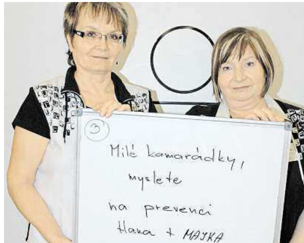
Účastníci mohli napsat vzkaz svým blízkým.

Příchozí mohli také napsat vzkaz svým blízkým a motivovat je k návštěvě preventivního vyšetření stejně tak, jako