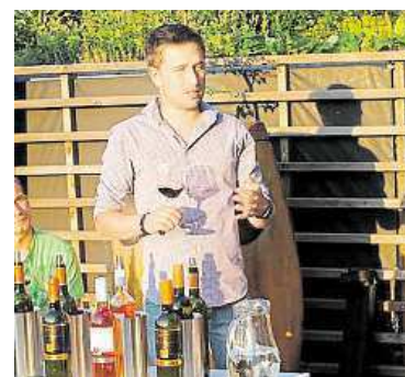
Ukázka degustace VINOZBLIZKA.CZ

Během deseti čtvrtečních setkání si tak návštěvníci až do září rozhodně přijdou na své. BAB