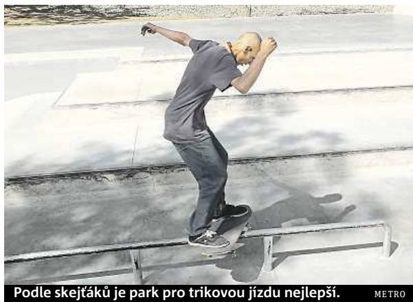
Podle skejťáků je park pro trikovou jízdu nejlepší.