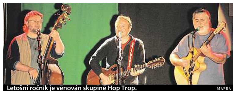
Letošní ročník je věnován skupině Hop Trop.