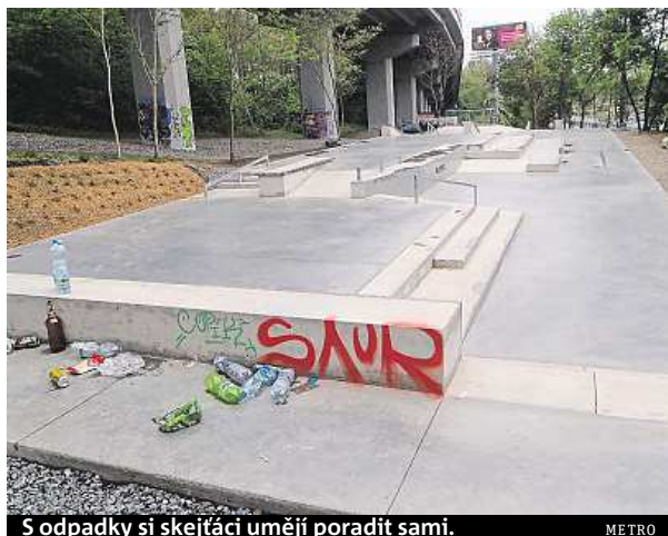
S odpadky si skejťáci umějí poradit sami.