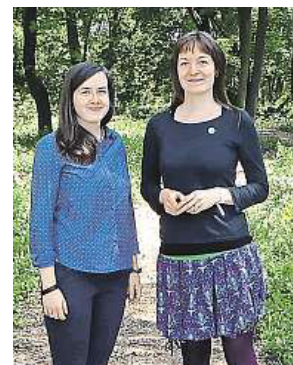
Zakladatelky hřbitova. METRO

která přišla s tím, že by na svém pohřbu ráda měla kruhové tance, aby se její duše lépe dostala na onen svět,“ usmívá se Dobešová. Ceny jsou tu jen o něco málo vyšší než na klasickém hřbitově. Za desetiletý pronájem zaplatíte čtyři tisíce korun, což ve