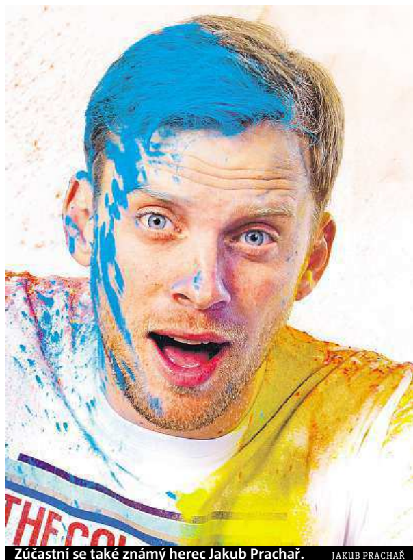
Zúčastní se také známý herec Jakub Prachař.