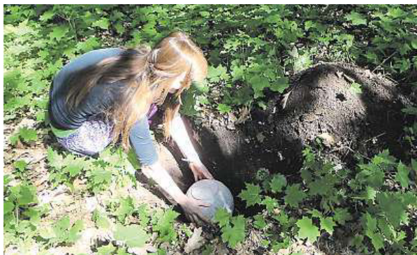
Popel je ukládán dva a půl metru od paty stromu. METRO

První alternativní obřady se budou v prostorách Ďáblického hřbitova konat již v prvním červnovém týdnu. Popel zemřelých se bude ukládat do země buď v ekologicky rozložitelných urnách nebo se do vyhloubeného důlku vysype z obřadní dřevěné mísy. Les má první ohlasy již nyní. „Na jedné z našich přednášek náš nápad nadchl jednu paní,