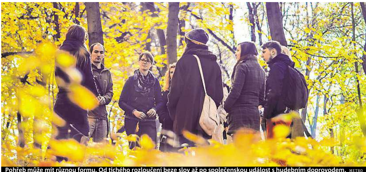
Pohřeb může mít různou formu. Od tichého rozloučení beze slov až po společenskou událost s hudebním doprovodem. METRO

V Lesu vzpomínek se budou lidé moci rozloučit se svými blízkými po svém. „Může jít pouze o tiché rozloučení nebo promluví více lidí, v pískovcové nádobě uprostřed lesa mohou na hladinu položit svíčku nebo pronést vzpomínku na zemřelého,“ představuje svou vizi Blanka Dobešová ze sdružení Ke kořenům. „Poslední rozloučení pod korunami stromů je osobitější než ve smutečních sí-