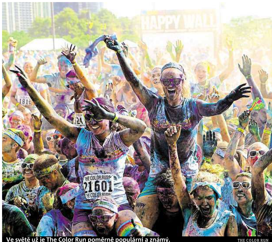
Ve světě už je The Color Run poměrně populární a známý.