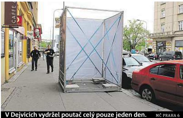
V Dejvicích vydržel poutač celý pouze jeden den. MČ PRAHA 6

„Kapesní krádeže, krádeže odložených věcí a součástek z automobilů v Praze obecně patří k nejčastějším přečinům,“ potvrzuje statistiku mluvčí Policie ČR Tomáš Hulan. Za loňský rok hlásí policie na šestce jeden případ pokusu o vraždu ve Vokovicích. Do statistik se dopsal případ ubití bezdomovce u stanice metra Hradčanská z roku 2013. Ze sto dvaceti čtyř ohlášených případů násilné trest-