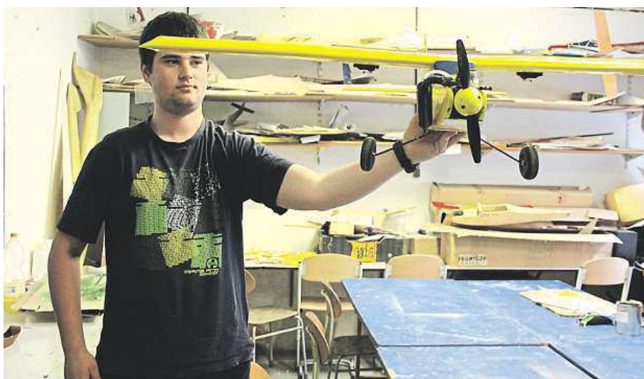
Ve Stanici techniků vás naučí postavit funkční modely i originální roboty.