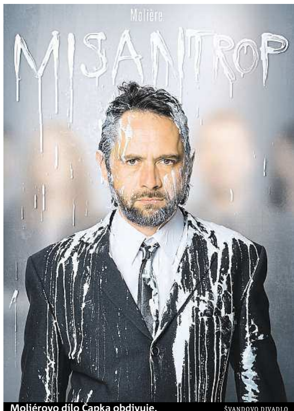
Moliérovu dílo Čapka obdivuje.