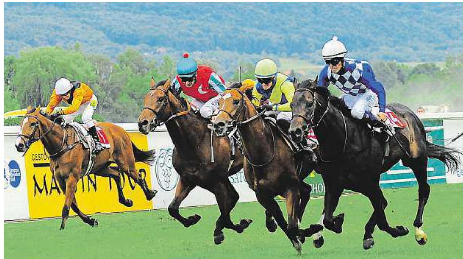
Doběh loňského Českého derby

Kolem šaten se výtahem dostáváme nahoru do útrob velké tribuny. Odtud mluví pan Zlámaný k divákům a sedí zde při závodech také rozhodčí. Ti kontrolují regulérnost