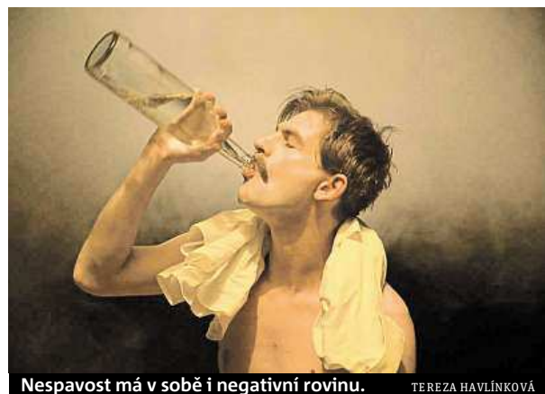
Nespavost má v sobě i negativní rovinu.