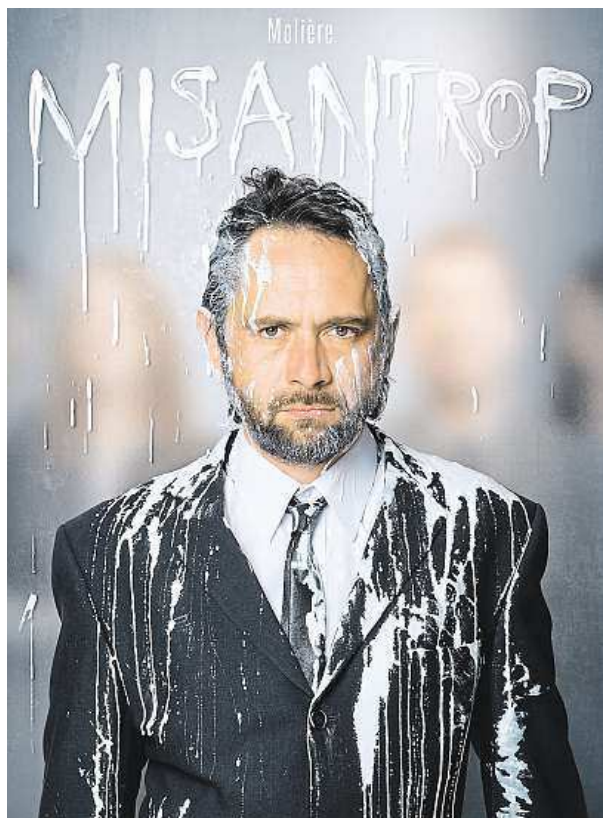
Moliérové dílo Čapka obdivuje.