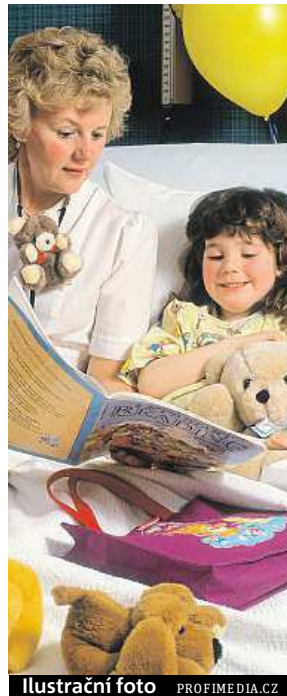
Ilustrační foto PROFIMEDIA.CZ