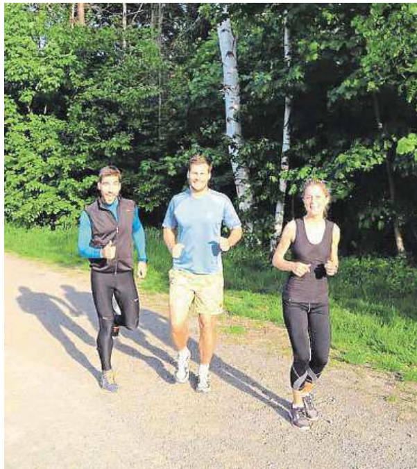
Někdy přijde i David Svoboda (vlevo).

vítěz v moderním pětiboji David Svoboda. Pokud se rozhodnete přidat ve čtvrtek 4. června, půjde už o jubilejní šedesátý sraz. PAVEL URBAN