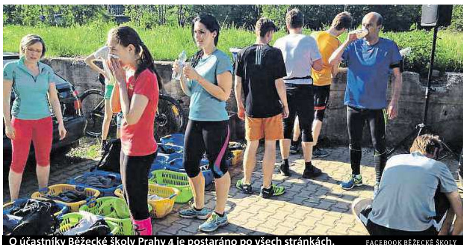
O účastníky Běžecké školy Prahy 4 je postaráno po všech stránkách. FACEBOOK BĚŽECKÉ ŠKOLY