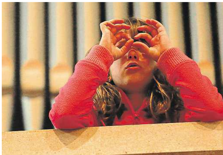
Kostel Nejsvětějšího Srdce Páně na náměstí Jiřího z Poděbrad

„Základem úspěchu je důmyslná pevná konstrukce dveří. Dveře musí splňovat vysoké parametry odolnosti proti vylomení, požáru, životnosti a měly by být samozřejmě zvukotěsné. Jejich funkci lze rozšiřovat o elektronické a elektrotechnické komponenty.“