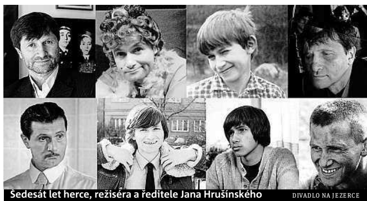
Sedesát let herce, režiséra a ředitele Jana Hrušínského