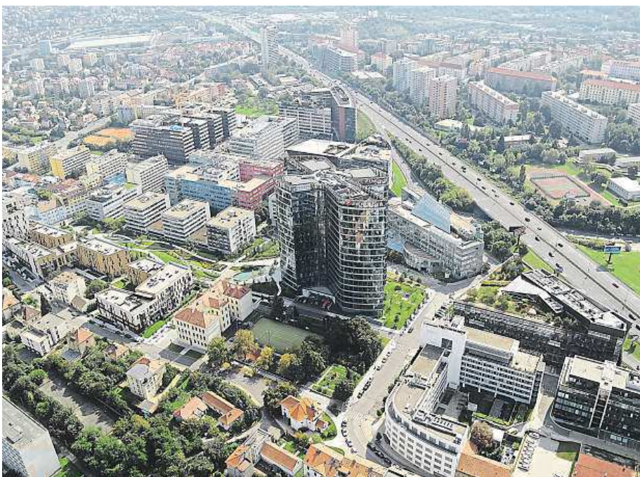
Radnice nefandí ani dalšímu rozšiřování areálu BB Centra na Brumlovce.

Rada přitom už v prosinci loňského roku vydala nesouhlasné stanovisko k územnímu rozhodnutí o umístění této stavby s pěti podzemními a osmnácti nadzemními podlažími u stanice metra Budějovická. „Tento stavební záměr je umísťován do nadlimitně zatíženého území,“