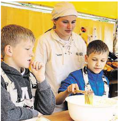
Stát se pekařem na jeden den si mohou vyzkoušet i malé děti.

Každý stánek na festivalu dostane své číslo a návštěvníci pro něj mohou celý víkend hlasovat. „Návštěvník vyplní název restaurace, která mu na akci byla nejpříjemnější