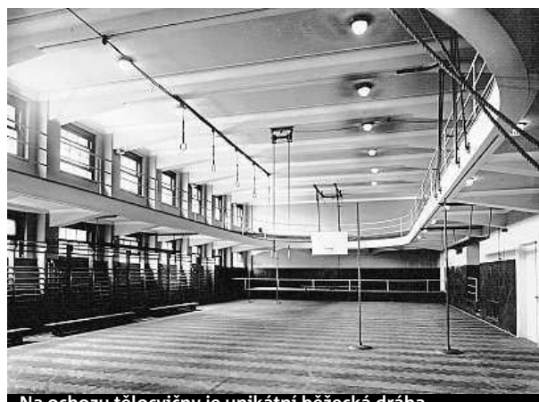
Na ochozu tělocvičny je unikátní běžecká dráha.

Dům byl otevřen v roce 1928. Zadáním bylo postavit polyfunkční objekt s levným ubytováním, s klubovnou a prostorem pro sport, s pasáží, kavárnou a jídelnou. Dodnes si můžete zaběhat na oválu výjimečné klopené běžecké dráhy umístěné na ochozu tělocvičny. Známý bazén téměř bez přestávky slouží veřejnosti už skoro devadesát let. ROW