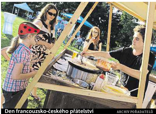
Den francouzsko-českého přátelství