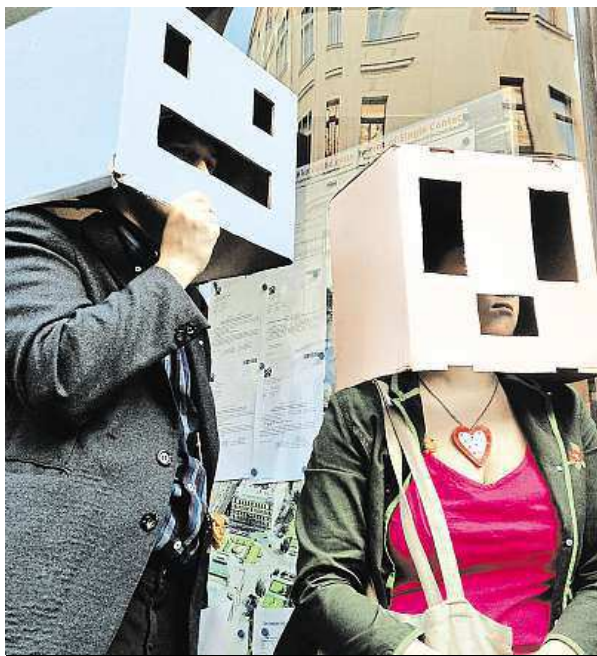
Lidé proti novostavbě Maršmelounu protestují. Krabice na hlavách připomínají jeho fasádu.

Mezi příklady zdařilé rekonstrukce podle něj patří třeba palác Langhans ve Vodičkově ulici, dostavba nárožní proluky na Petřském náměstí, revitalizace bastionu U Božích muk nebo palác Euro na Můstku. Pokud má ale poukázat na ty nepovedené, je Švejda opatrný. „Nezdařilé realizace je těžké jmenovat. Těm zdařilým se totiž udělují ocenění,