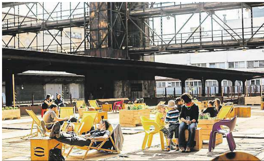
Pohoda na Nákladovém nádraží Žižkov

Projekt KineDok organizovaný Institutem dokumentár-