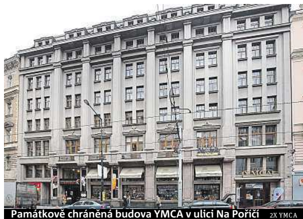
Památkově chráněná budova YMCA v ulici Na Poříčí 2X YMCA