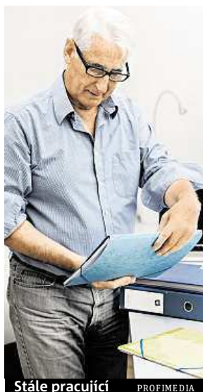
Stále pracující

Studie provedená se šesti českými firmami také odhalila, že Češi si nemoci příliš nepřipouštějí. Ve výzkumu uváděli v průměru o jednu až dvě diagnózy méně, než u nich odhalila lékařská vyšetření. Podle nich