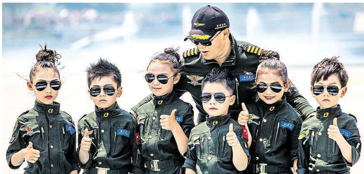
Letecká show v čínském Anyangu byla atrakcí pro dospělé i malé děti. Ty si mohly vyzkoušet například bundy pilotů.

Jídlo. V nemocnicích, porodnicích a zařízeních sociálních služeb za moc nestojí. Maminky. Jejich strava postrádá energetickou hodnotu, nesprávný je i poměr základních živin. Pacienti. Chybí i pestrost STRANA 2