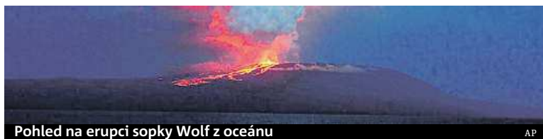
Pohled na erupci sopky Wolf z oceánu