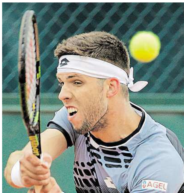
Veselý zahrál méně vítězných míčů i es než Argentinec.