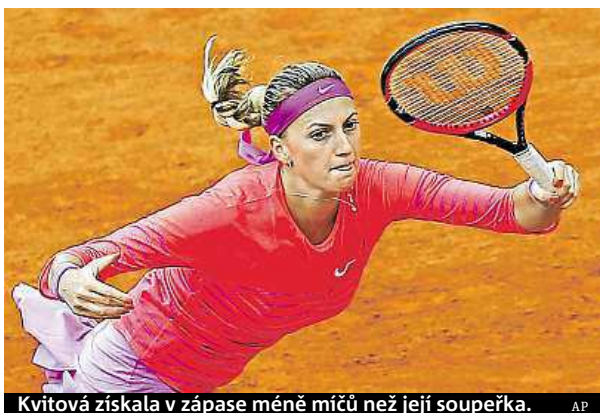
Kvitová získala v zápase méně míčů než její soupeřka.

Světová čtyřka se trápila dvě a půl hodiny s Marinou Erakovicovou z Nového Zélandu.