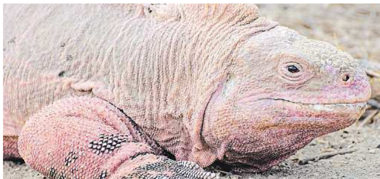
Druh růžových leguánů byl objeven až v roce 1986.

Galapágy turisté, kteří kolem ostrova proplouvali. Správa parku poté vyslala nad ostrov letadlo, aby posoudilo rozsah škod – zatím nebylo možné zjistit, zda a do jaké míry je unikátní kolonie leguánů ohrožena. ČTK