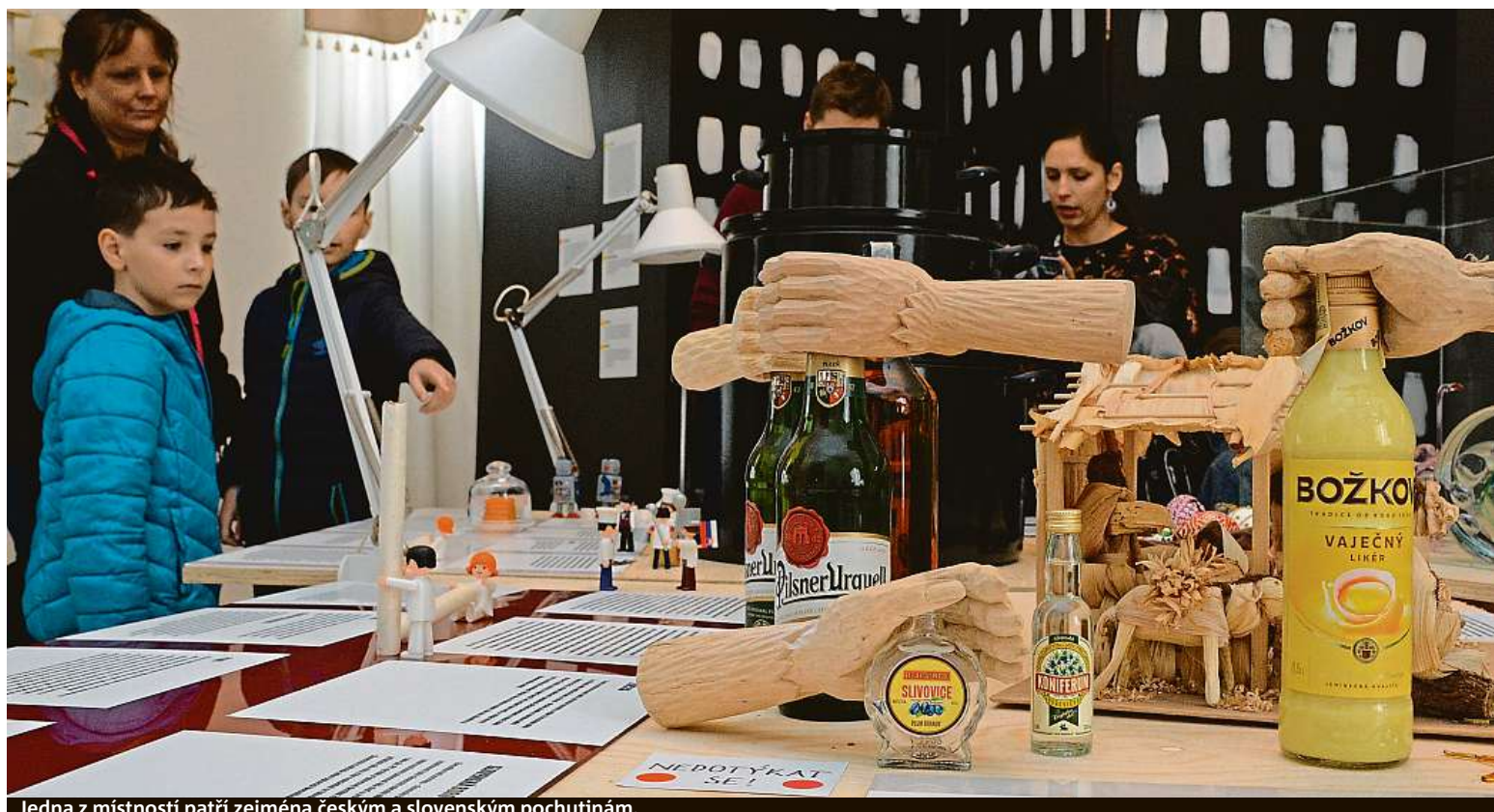
Jedna z místností patří zejména českým a slovenským pochutinám.