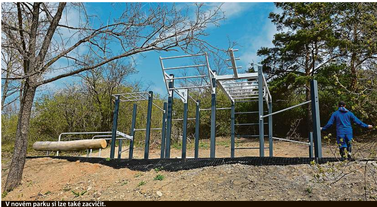
V novém parku si lze také zacvičit.