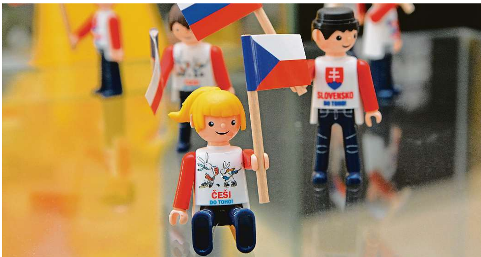
Letohrádkem Mitrovských provázejí igráčci.

zajímavou historii, ale také výjimečné vynálezy, specifické zvyky a významné osobnosti. Celou výstavou provází legendární postavy igráčků. V expozicích si připomenete pohádkové postavy, které do- byly svět – Krtečka, Spejbla a Hurvínka i Ferdu Mravence.