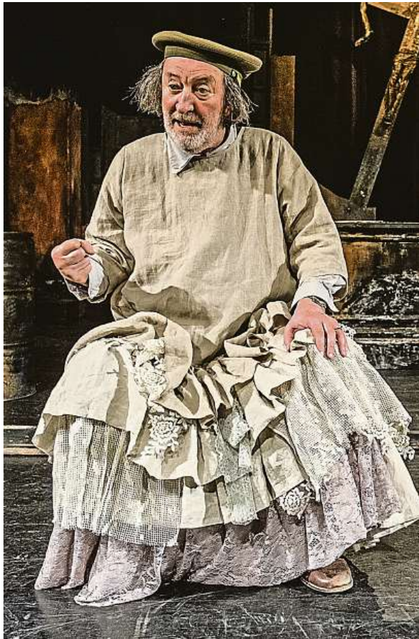
Bolek Polívka jako tulák v rozbořeném kostele

Nejbližší představení se hraje právě dnes. Po pražské premiéře ve Studiu DVA jsou další brněnské reprízy na programu 24. a 25. května. BAB