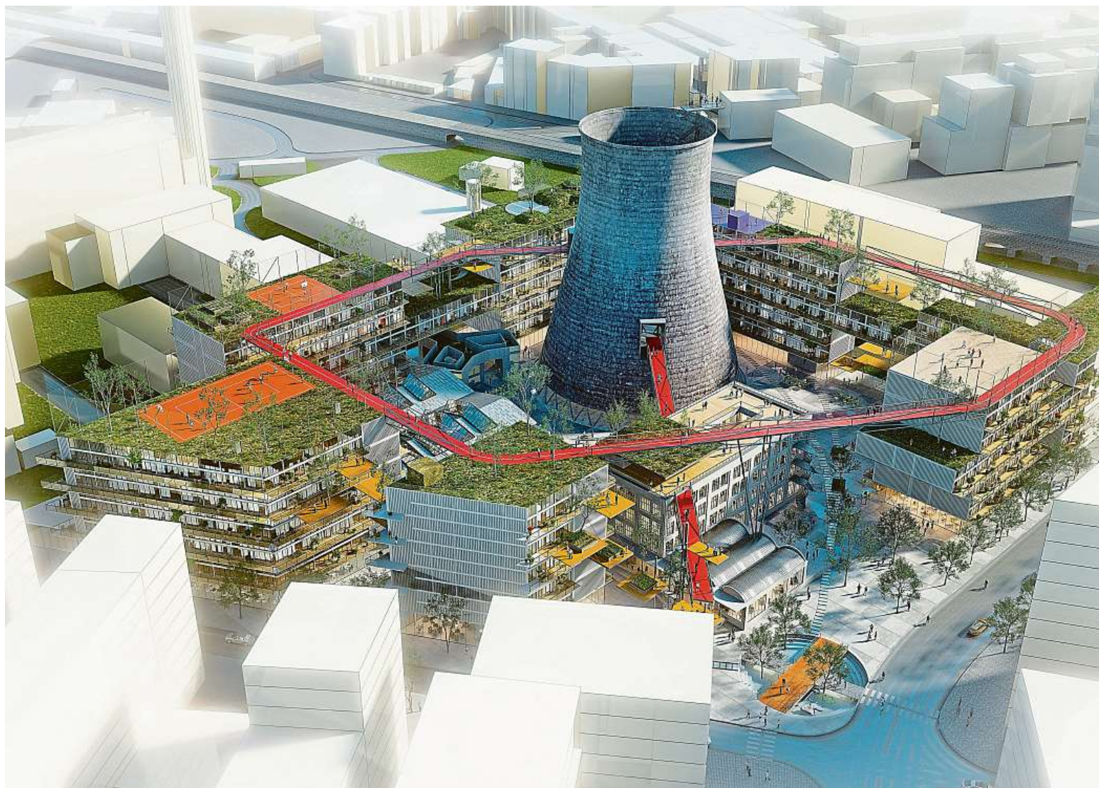
Kolem původní chladicí věže, která bude dominantou nové čtvrti, povede 400 metrů dlouhá promenáda.