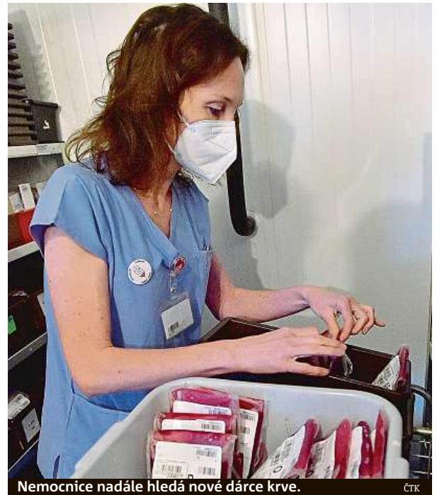
Nemocnice nadále hledá nové dárce krve. ČTK

Fakultní nemocnice Brno zásobuje krví také jiná zařízení. Jsou to jak nemocnice v kraji, tak i jinde. Loni brněnská nemocnice zahájila výjezdní odběry krve ve firmách a organizacích v Brně a okolí. „Jedním z důvodů byla reakce na aktuální epidemickou situaci, která dárce od návštěvy nemocnice odrazovala, dílem šlo o reakci na déletrvající poptávku ze strany firem uspořádat odběr krve pro zaměstnance přímo na pracovišti. Odběry mimo nemocnici se hned v prvním roce ukázaly jako úspěšné a pomáhají významným způsobem rozšiřovat dárcovský registr,“ řekla Plachá. Nemocnice nadále hledá nové dárce, nejvíce skupinu A, ale také univerzální 0-, u které je mírně větší spotřeba. ČTK