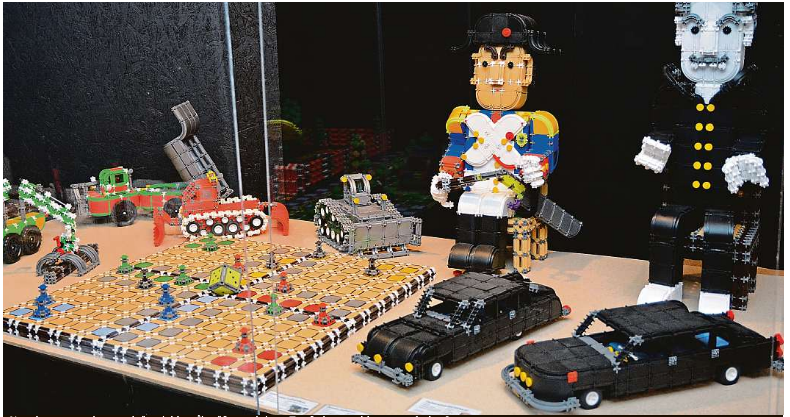
Napoleon, tatrovky a společenská hra Člověče, nezlob se. To vše lze vyrobit ze stavebnice Seva.

ticky čehokoli – a výstava v letohrádku vás o tom přesvědčí. K vidění tu je Rubikova kostka, obří had, papoušek či pes, hra Člověče, nezlob se, Napoleon, velké hasičské auto, mlýn nebo rozlehlá vila. To vše postavené z legendární stavebnice. BAB