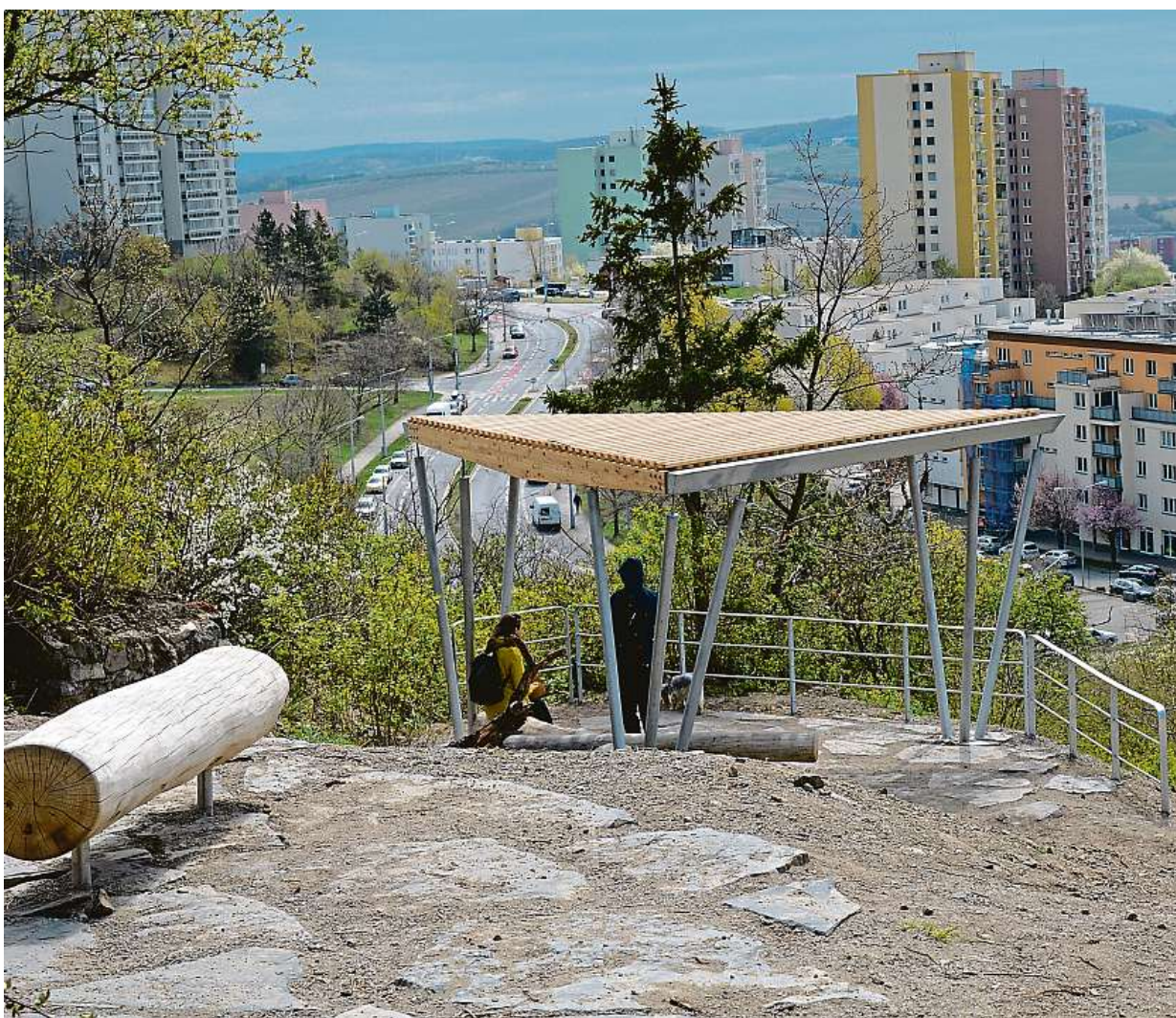
Kamenný vrch se tyčí přímo nad sídlištěm.