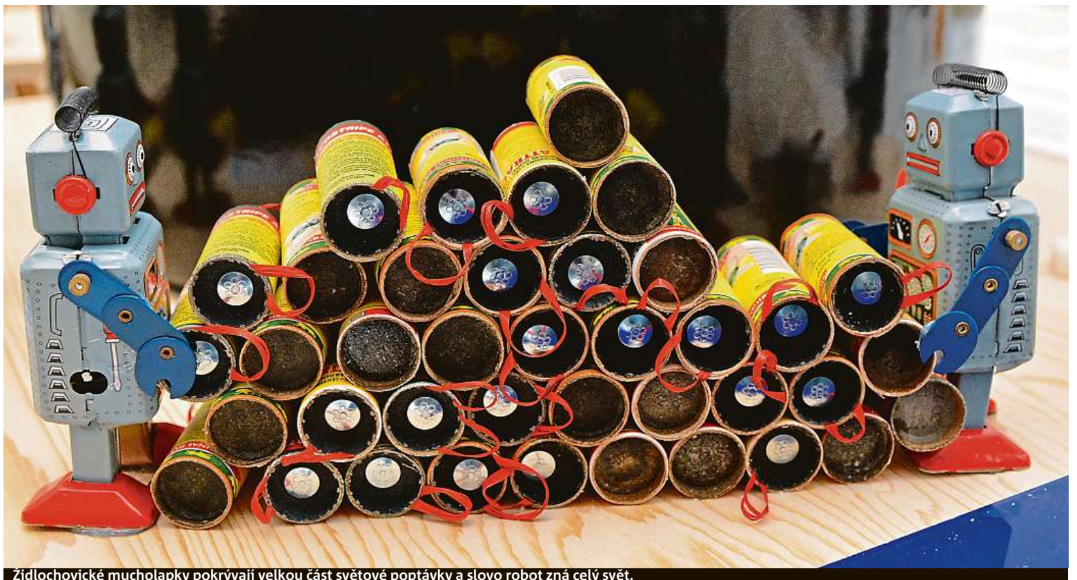
Zidlochovické mucholapky pokrývají velkou část světové poptávky a slovo robot zná celý svět.