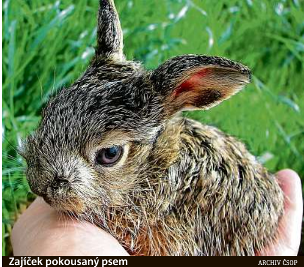
Zajíček pokousaný psem