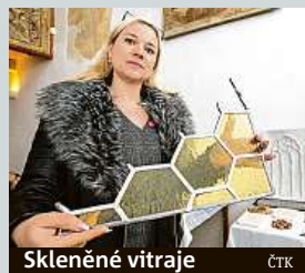
Skleněné vitraje ČTK

České památky se chystají na letošní turistickou sezonu. Podle památkářů se do objektů investovaly další desítky milionů korun. Včera v Mostě na tiskové konferenci k zahájení sezony byly představeny také haptické pomůcky, s jejichž pomocí mohou i nevidomí návštěvníci památky „vidět“. Díky nim si mohou udělat jasnou představu o tom, jak vypadá například kostel Nanebevzetí Panny Marie v Mostě. ČTK