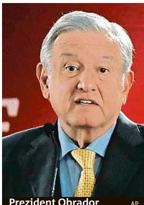
Prezident Obrador

Obrador na videu natočeném na mayských ruinách ve státě Tabasco a zveřejněném na sociálních sítích sdělil, že dobytí bylo činěno mečem a křížem a požádal o omluvu původním obyvatelům za porušení toho, čemu se nyní