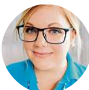
Anděla Rajská Látkové, když mám rýmu. Na běžné užívání papírové.