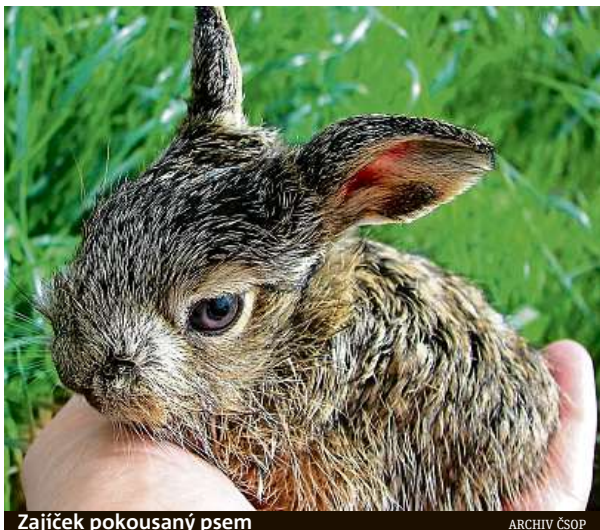
Zajíček pokousaný psem