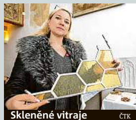
Skleněné vitraje ČTK

České památky se chystají na letošní turistickou sezonu. Podle památkářů se do objektů investovaly další desítky milionů korun. Včera v Mostě na tiskové konferenci k zahájení sezony byly představeny také haptické pomůcky, s jejichž pomocí mohou i nevidomí návštěvníci památky „vidět“. Díky nim si mohou udělat jasnou představu o tom, jak vypadá například kostel Nanebevzetí Panny Marie v Mostě. ČTK