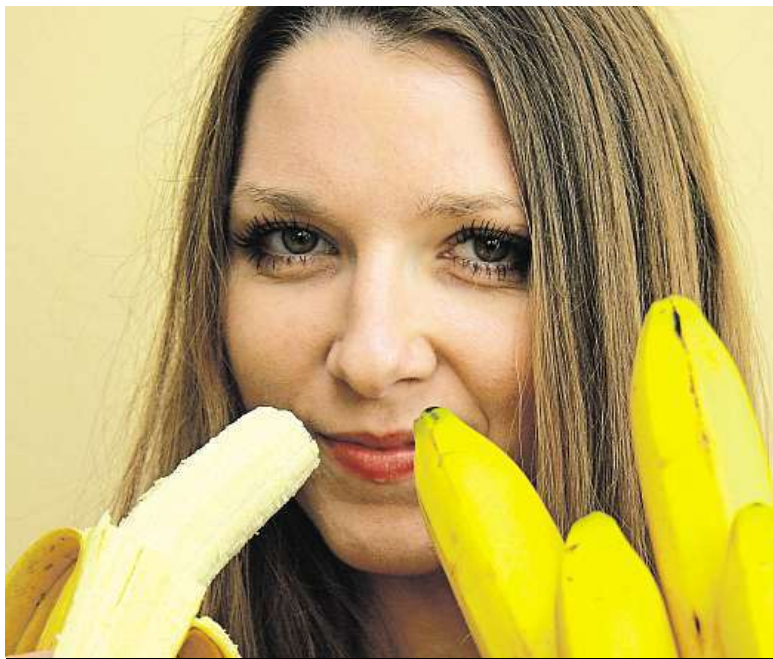
Hořčík je vydatně obsažen v banánech.