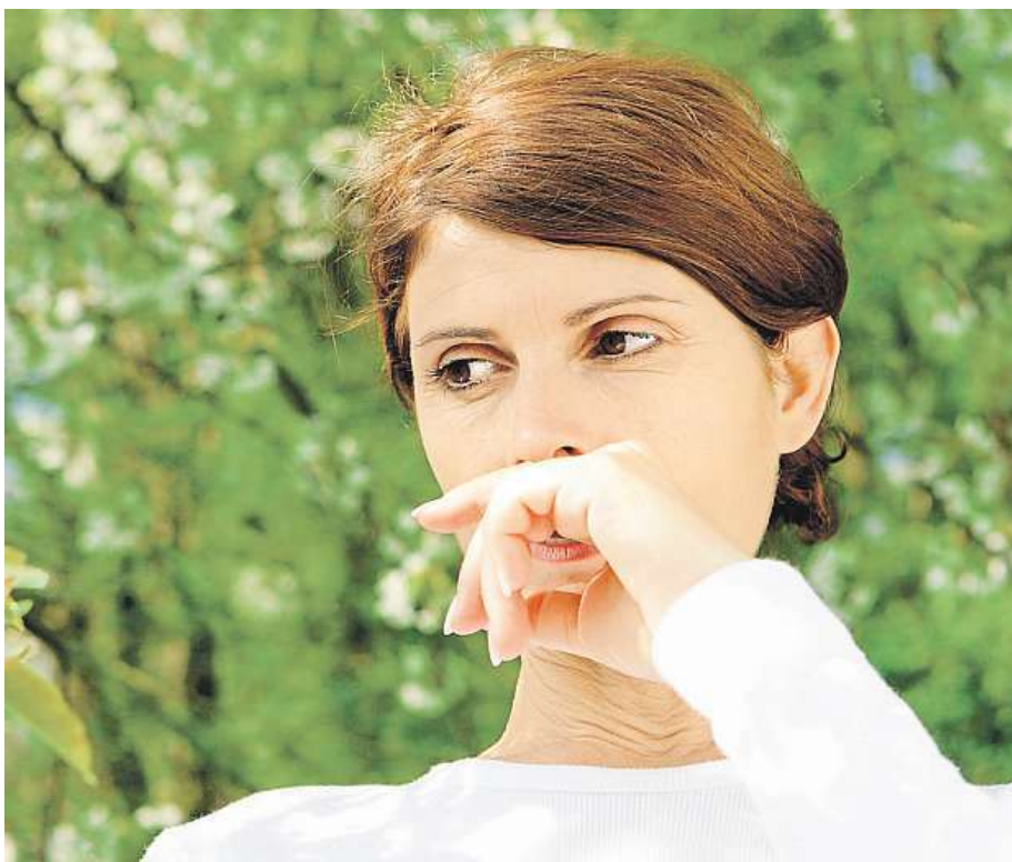
Alergická sezona nadchází, zarudlému nosu jde předejít.

Alergie se zpravidla projevují častým kýchním a rýmou. Nepříjemností, které tak musí alergici čelit, je zarudlý a poškrábaný nos. V tomto případě co nejvíce omezte používání dekorativní kosmetiky v této oblasti a vyvarujte se přípravkům s obsahem alkoholu, které mohou kůži ještě více vysu-