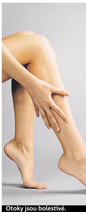
Otoky jsou bolestivé.

Účinný způsob léčby zahrnuje zevní kompresi, podávání venofarmak, lymfodrenáž, cvičení a režimová opatření. Zevní komprese představuje základní pilíř konzervativní terapie chronického žilního onemocnění. Provádí se pomocí speciálních obinadel nebo kompresivních punčoch, které představují zevní bariéru pro šíření otoku a podporu žilního systému. Další součástí je farmakoterapie. „Role venofarmak, která vám předepíše ošetřující lékař, je během léčby velmi důležitá,