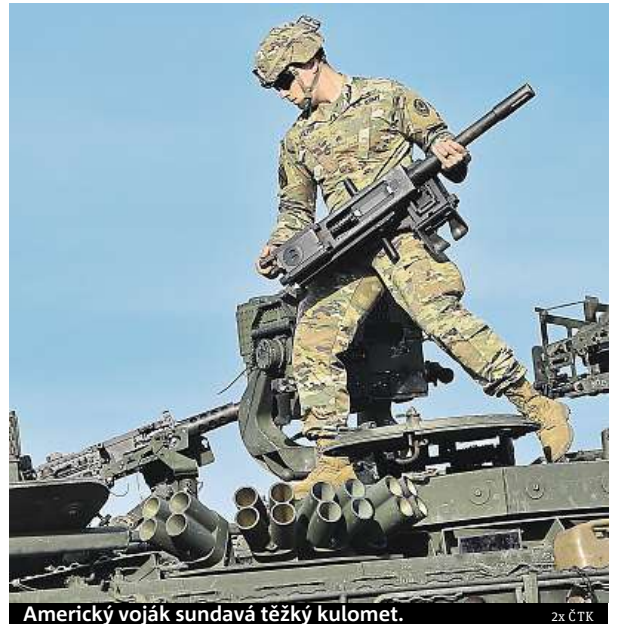
Americký voják sundává těžký kulomet.