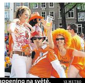
Vyladte si outfit na největší happening na světě.