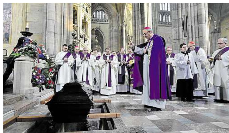
Obřady posledního rozloučení vedl olomoucký arcibiskup Jan Graubner.

Jen pražským arcibiskupům je vyhrazena mimořádná pocta, být pohřbeni po boku českých králů a svých předchůdců v katedrále svatého Víta na Pražském hradě. Tělo zesnulého kardinála Miloslava Vlka bylo v sobotu po církevních obřadech uloženo do nové arcibiskupské hrobky v nové části katedrály.