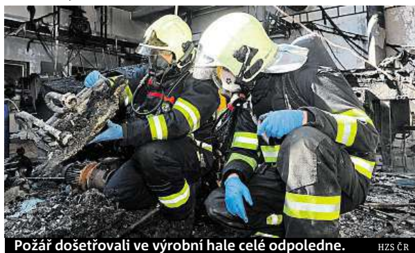
Požár došetřovali ve výrobní hale celé odpoledne.

Na místě zasahovali tři profesionální a dvě dobrovolné jednotky. Profesionálním hasičům pomáhali i kolegové z dobrovolných sborů z Běchovic a Kbel.