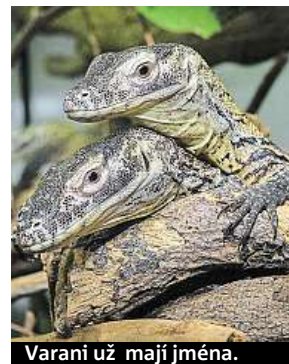
Varani už mají jména.

Dalším zajímavým bodem slavnosti byly křtiny tří mláďat varanů komodských, kteří dostali jména Flores, Komodo a Padar. Jak zahrada v sedmdesátých letech vypadala ukáže i nová výstava Uspěšná sedmdesátá v Galerii Gočárovovy domy. ROBERT OPPELT