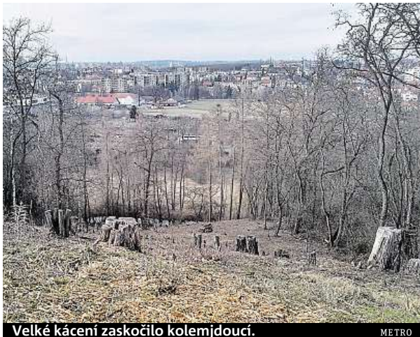
Velké kácení zaskočilo kolemjdoucí.

Trnovníků akátů se z Hostivaře rozhodly vymýtít Lesy hlavního města Prahy již v roce 2013. Stromy pocházející původně ze Severní Ameriky, které zde byly vysazeny