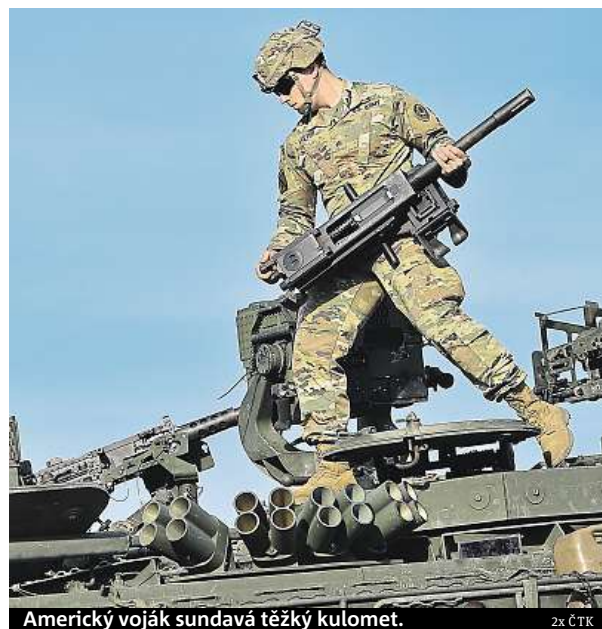
Americký voják sundává těžký kulomet.