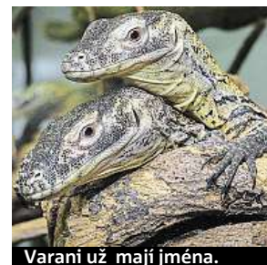
Varani už mají jména.

slavnosti byly křtiny tří mláďat varanů komodských, kteří dostali jména Flores, Komodo a Padar. Jak zahrada v sedmdesátých letech vypadala ukáže i nová výstava Úspěšná sedmdesátá v Galerii Gočárových domů. ROBERT OPPELT