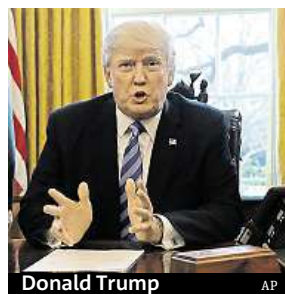
Donald Trump

Americká média hovoří o ohromujícím debaklu, brutální porážce a osudovém znamení pro Donalda Trumpa, který zrušením Obamacare považoval za bezmála hlavní pilíř svého vnitropolitického programu. Zraky veřejnosti a novinářů budou teď upřeny na další Trumpovy záměry - na daňovou reformu, rozvoj infrastruktury a rozpočet. Ochromen je nejen Bílý dům, ale i Kongres ovládaný republikány. Každý republikánský