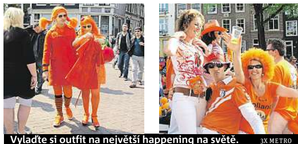
Vyladte si outfit na největší happening na světě.