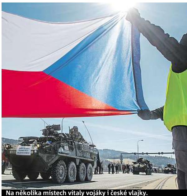
Na několika místech vítaly vojáky i české vlajky.

Konvoj musel letos zvolit jinou trasu než při předchozích průjezdech. Kvůli opravě čtyřproudé silnice před Hradcem Králové musel sjet z dálnice D11 už u Chlumce nad Cidlinou a pokračovat po silnici I/11. I ta se však před Hradcem opravuje. Vojáci objeli Hradec Králové a pokračovali dál na Jaroměř a Náchod. Podobně jako v sobotu je doprovázela Policie ČR a Vojenská policie. DNES.cz