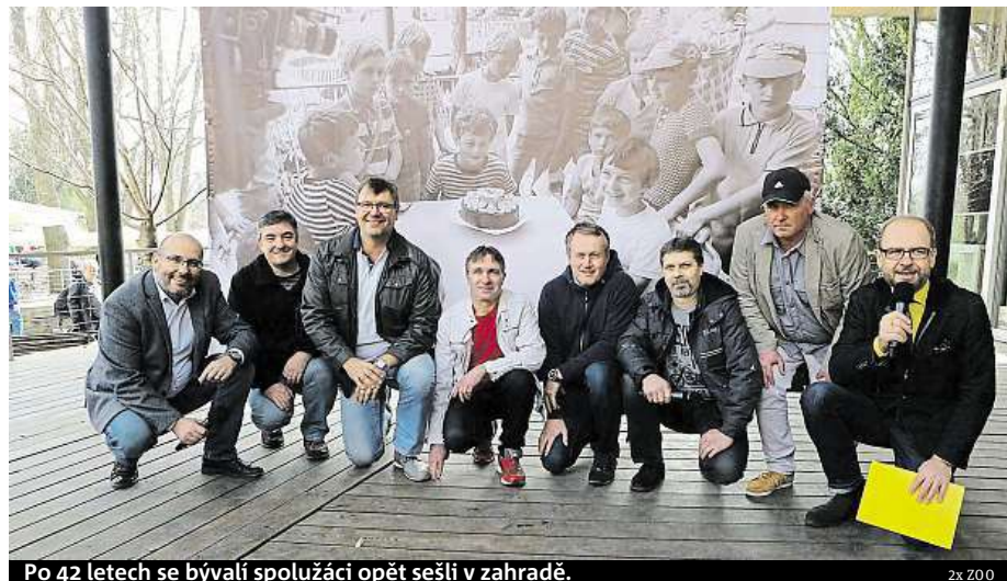
Po 42 letech se bývalí spolužáci opět sešli v zahradě.