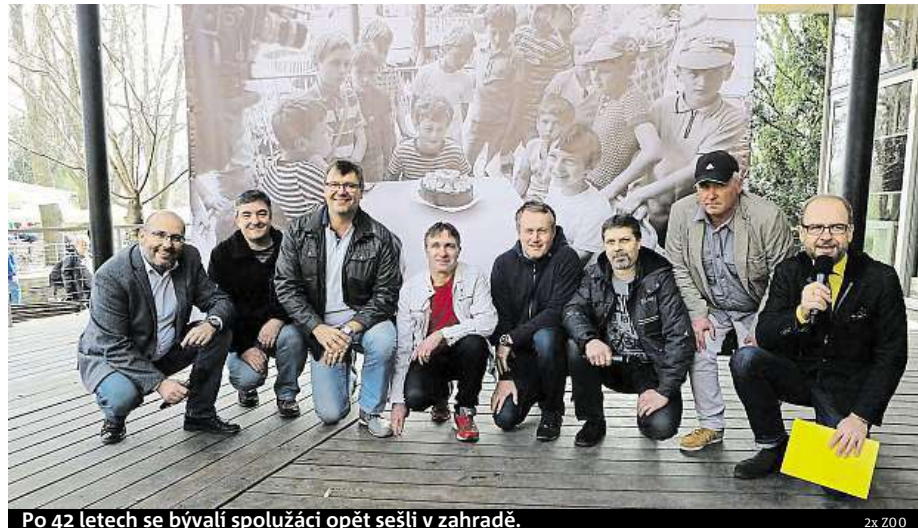
Po 42 letech se bývalí spolužáci opět sešli v zahradě.