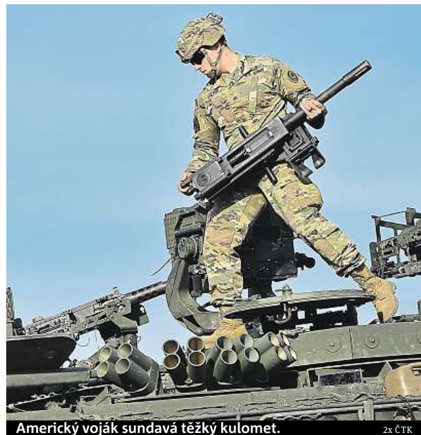
Americký voják sundává těžký kulomet.