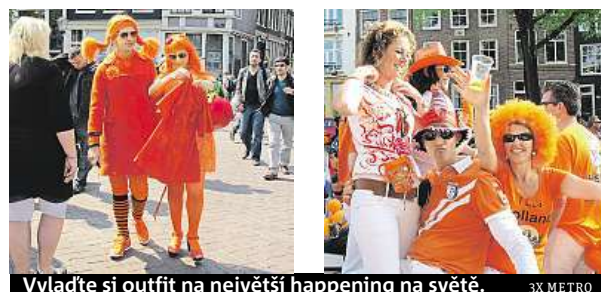
Vyladte si outfit na největší happening na světě.