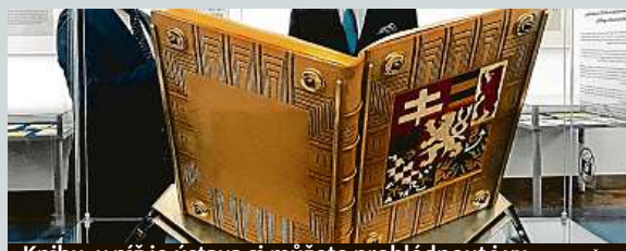
Knihu, v níž je ústava si můžete prohlédnout i vy. ČTK

Ve sněmovních kuloárech je nově k vidění zrestaurovaná slavnostní provedení československé ústavy přijaté 29. února 1920, tedy před sto lety, tehdejšími Národním shromážděním. Samotné dílo vznikalo v letech 1929 až 1932. Spatřit ho mohou návštěvníci například v rámci sněmovních exkurzí. ČTK