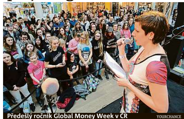
Předškolní ročník Global Money Week v ČR

Do GMW 2019 se zapojí 169 zemí světa a více než