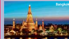
1. den: Cesta do Bangkoku