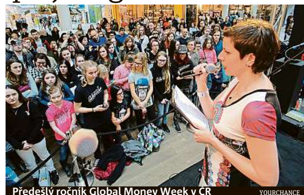
Předškolní ročník Global Money Week v ČR

Do GMW 2019 se zapojí 169 zemí světa a více než