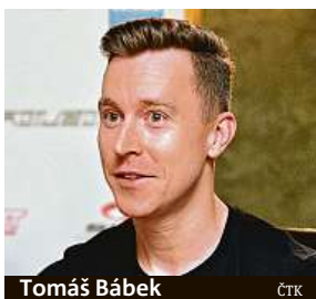
Tomáš Bábek ČTK

Ve hře jsou medaile z mistrovství světa, ale také body do olympijské kvalifikace.