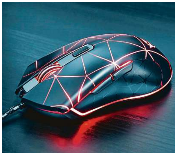
Herní myš Trust