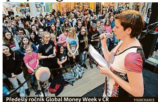
Předšlý ročník Global Money Week v ČR

Do GMW 2019 se zapojí 169 zemí světa a více než