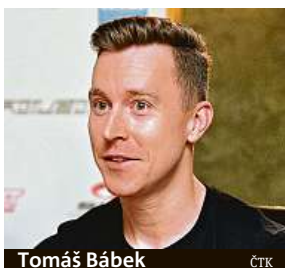
Tomáš Bábek ČTK

Ve hře jsou medaile z mistrovství světa, ale také body do olympijské kvalifikace.