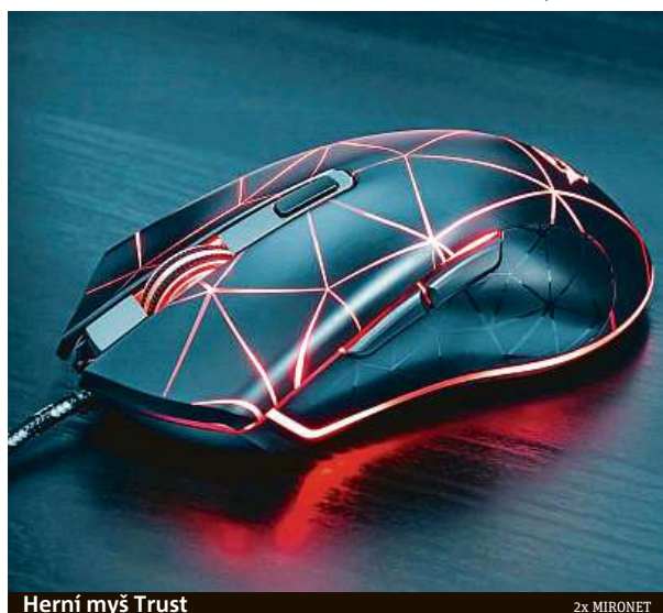
Herní myš Trust