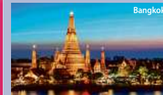
1. den: Cesta do Bangkok