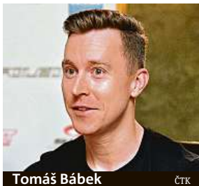
Tomáš Bábek ČTK

Ve hře jsou medaile z mistrovství světa, ale také body do olympijské kvalifikace.