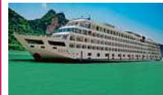
1. den: Príchod do Šanghaja