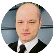
Jakub Stupka Mám jaro 365, někdy 366 dní v roce.