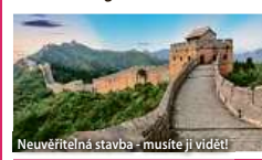
Neuvěřitelná stavba - musíte ji vidět!