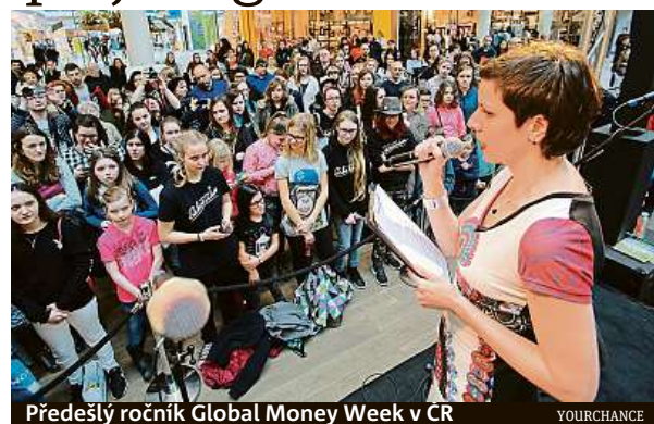
Předškolní ročník Global Money Week v ČR

Do GMW 2019 se zapojí 169 zemí světa a více než