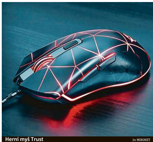
Herní myš Trust