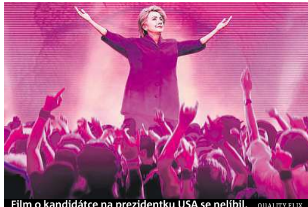
Film o kandidátce na prezidentku USA se nelíbil. QUALITY FLIX

Dokument Hillary's America: The Secret History of the Democratic Party (Amerika podle Hillary aneb Tajné dějiny Demokratické strany), v němž konzervativní komentátor a autor úspěšně prodávaných knih Dinesh D'Souza kritizuje neúspěšnou demokratickou kandidátku na prezidenta, získal celkem čtyři Zlaté maliny. Kromě titulu nejhorší film dostal D'Souza od poroty cenu za nejhoršího herce za výkon komentátora