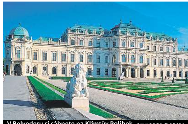
V Belvederu si sáhnete na Klimtův Polibek.

Až milion turistů ročně se jezdí dívat do Belvederu na mistrovská díla Gustava Klimta. Sahať se na ně ale nesmí. Ale spouť ne na originály, ale najdete tu i jednu výjimku. „Díky 3D modelu slavného obrazu Polibek, který je vrcholným dílem umělce Zlatého období a dnes ho obdivuje celý svět, tady můžete cítit tahy umělce štětky a po-