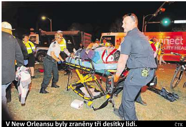
V New Orleansu byly zraněny tři desítky lidí.

Poslední incident se stal v neděli ve čtvrti Bellingham na jihovýchodě Londýna, kdy najelo auto do skupiny chodců a pět lidí bylo zraněno. „Policisté obdrželi kolem 8.20 (9.20 SEČ, pozn. red.) v neděli ráno oznámení o srážce auta s množstvím chodců v Bellinghamu,“ uvedl londýnský policejní mluvčí. Pozadí incidentu zatím není jas-