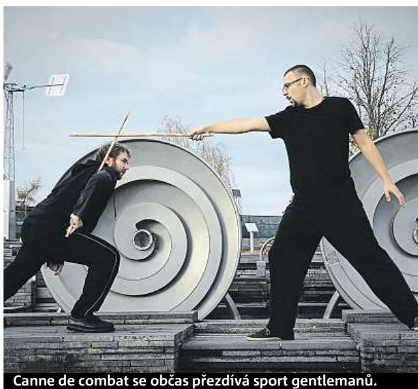
Canne de combat se občas přezdívá sport gentlemanů.

Poté, co si s přesně devadesátipěticentimetrovou jasanovo-ořechovou holí na vlastní