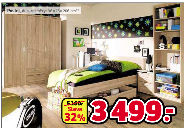
Postel, dub, rozměry: 96×76×206 cm**