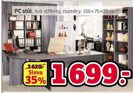
PC stůl, dub stříbrný, rozměry: 150×75×75 cm**