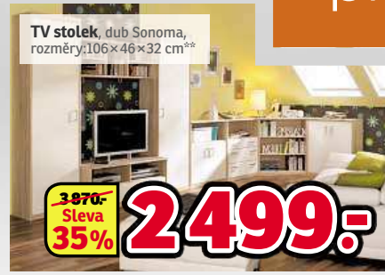
TV stolek, dub Sonoma, rozměry: 106×46×32 cm**