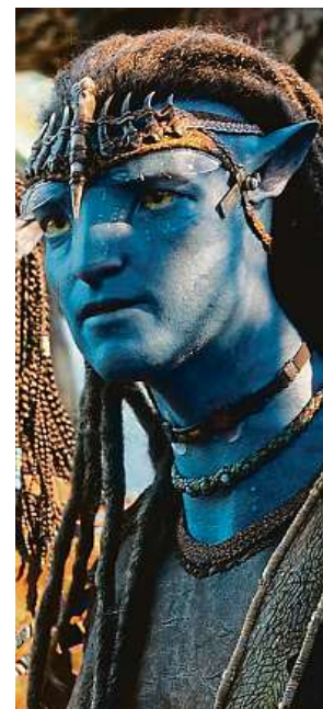
Příběh Avatara 3 začíná pár týdnů po dvojce. 2x FALCON