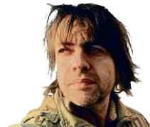
IVAN ADAMOVIČ PRŮVODCE PŘÍTOMNOSTI

V první řadě sebevědomí. Už prvním ponorem jste v tomto ohledu překonali 95 procent vašich spoluobčanů. Asi tak po hodině, už pěkně v teple, se pak dostaví záplava hormonů štěstí a spokojenosti. Ta vám vydrží notnou část dne. Je to nejlevnější sport, který vám dodá nejlevnější „drogu“. Někteří tvrdí, že jsou na dopaminu po otužování vysloveně závislí a nervózně na konci zimy sledují, jak ručička teploměru každým dnem stoupá. A těch lajků na sociálních sítích, to je pak druhá dávka drogy. Asi za to můžou ty mrazy. Hlava koukající z ledu je víc cool než „jen“ informace, že jste ve vodě v ledu.