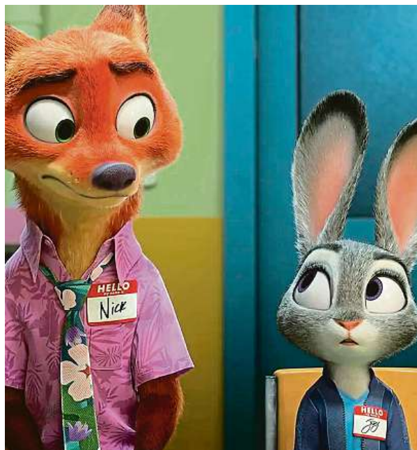
Zootropolis: Město zvířat 2 je pokračováním filmu z roku 2016. Na hlavní hrdiny Judy Hopkovou a Nicka Wilde čeká nový případ.