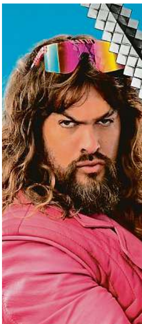
Jason Momoa jako Smeták v Minecraft filmu