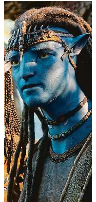
Příběh Avatara 3 začíná pár týdnů po dvojce. 2x FALCON