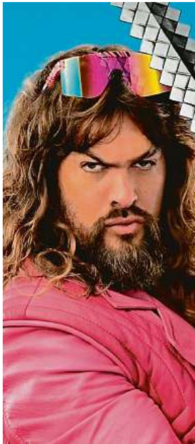
Jason Momoa jako Smeták v Minecraft filmu