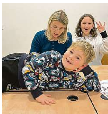
Kurzy začal spolek pořádat loni.