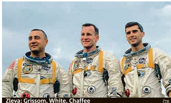
Zleva: Grissom, White, Chaffee

Firma North American údajně získala mnohamiliardový kontrakt na vývoj a výro-