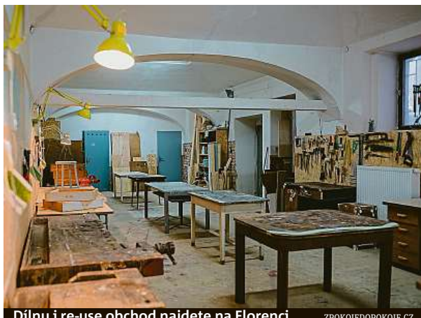
Dílnu i re-use obchod najdete na Florenci.

Podle Kuberové je OZO Ostrava skvělým příkladem, jak by re-use centra mohla fungovat. V Praze podle ní podobné velké centrum chybí. „V metropolii jsme v poměrně v neutešeném stavu, magistrát si přitom důraz na cirkulární ekonomiku stanovil jako jednu z priorit,“ připomíná. MAH