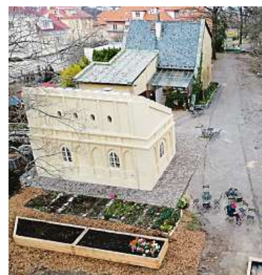
Košířská Hájojně 2x SPOLEK HÁJOJNĚ

Košířské komunitní centrum Hájojně, které sídlí na okraji lesoparku Cibulka, od února nabízí bezplatné kurzy pro samoživitele a jejich děti. Určeny jsou i rodinám, které se ocitly v tíživé sociální, finanční nebo jinak svízelné situaci. Kurzy rodičům poskytnou jedno odpoledne v týdnu, kdy si oddechnou a stráví čas svým vlastním programem. Lekce pro děti i dospěle probíhají současně. To vše zdarma v prostředí areálu novogotické hájojny.