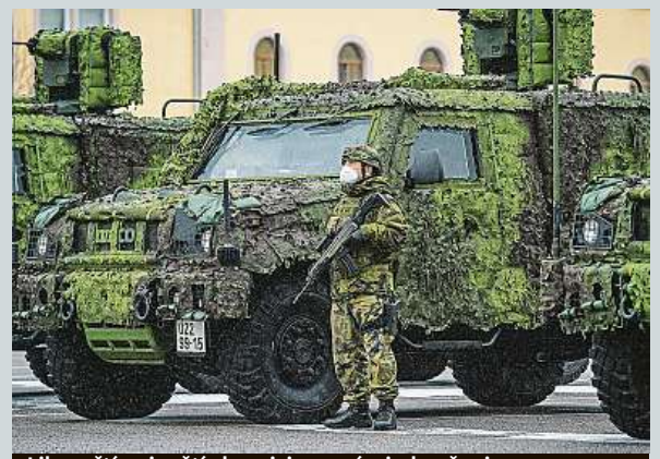
Liberečtí vojenští chemici s novými obrněnci

Liberečtí vojenští chemici jako první převzali nová průzkumná lehká obrněná vozidla české výroby. Vojákům z elitního 31. pluku radiční, chemické a biologické ochrany generálmajora Oskara Starkoče budou vozidla sloužit k pozorování a odběru vzorků. Další auta dostanou. ČTK