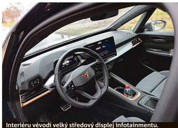
Interiéru věvodí velký středový displej infotainmentu.

Neklidná situace na trhu s ojetými vozy se projevuje nejen omezenou nabídkou a vyššími cenami, ale i podstatně kratší dobou, po kterou auta vydrží v nabídce. Zájemci o ojetinu tak nesmí dlouho váhat. Průměrná doba, po níž jsou inzerované automobily v nabídce, klesla z 52 dní na 32. Například v Česku nejoblíbenější Škoda Octavia se prodá nejčastěji za 29 dní, před dvěma lety to trvalo 47 dní. Více než kdy dřív tak v segmentu aut z druhé ruky platí – kdo dřív přijde, ten dřív jede. Data vyplývají z kontinuálního monitoringu trhu ojetých automobilů mezinárodní sítě autocenter AAA AUTO. HOP