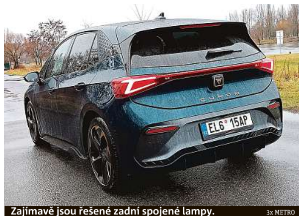
Zajímavé jsou řešené zadní spojené lampy.