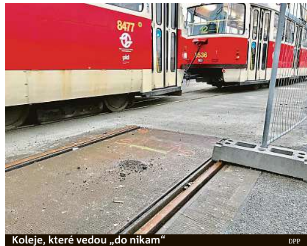
Koleje, které vedou „do nikam“

Na situaci, kdy si tramvaje na provizorním jednokolejním úseku kvůli stavebním