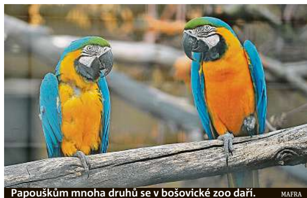
Papouškům mnoha druhů se v bošovicke zoo daří.

Návštěvníci se mohou těšit i na mláďata, která se vylíhla přes zimu. Ke konci roku přišli na svět například papoušiči žlutolíci či aratingy červenohrdlé, letos například aratingy hnědohrdlé.