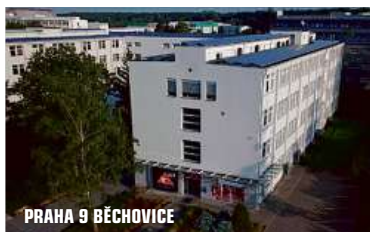
PRAHA 9 BĚCHOVICE

Jsme česko-belgická firma a na trhu působíme již od roku 1994. Naší hlavní činností je import karosářských dílů a vybavení pro MOTO.