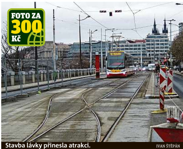
Stavba lávky přinesla atrakci.