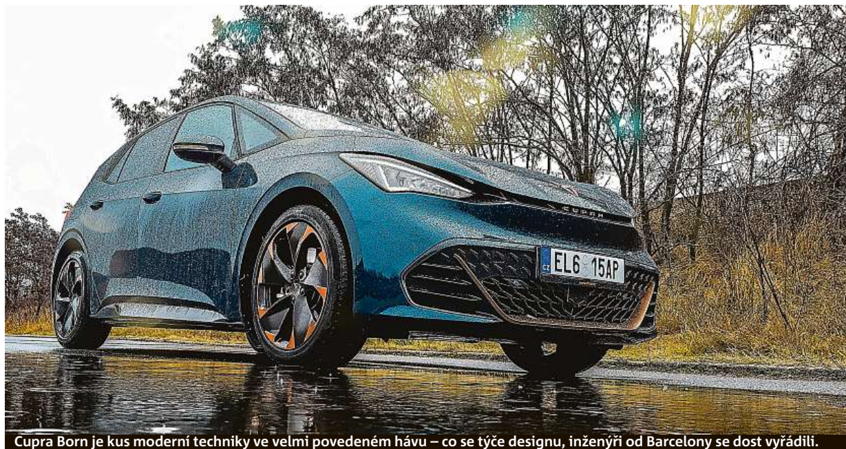
Cupra Born je kus moderní techniky ve velmi povedeném hávu – co se týče designu, inženýři od Barcelony se dost vyřádili.