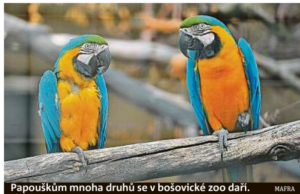
Papouškům mnoha druhů se v bošovicé zoo daří. MAFRA

Návštěvníci se mohou těšit i na mláďata, která se vylíhla přes zimu. Ke konci roku přišli na svět například papoušiči žlutolíci či aratingy červenohrdlé, letos například aratingy hnědohrdlé. ČTK