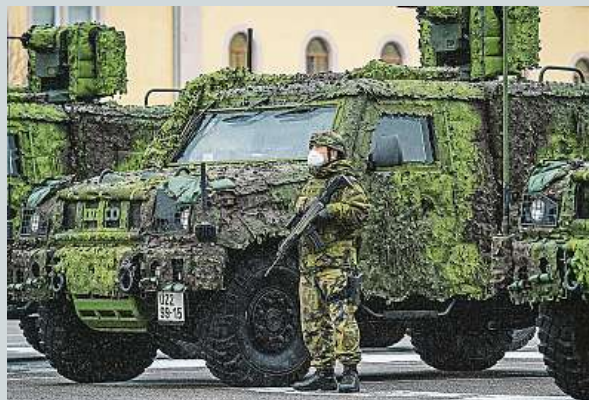
Liberečtí vojenští chemici s novými obrněnými

Liberečtí vojenští chemici jako první převzali nová průzkumná lehká obrněná vozidla české výroby. Vojákům z elitního 31. pluku radiální, chemické a biologické ochrany generálmajora Oskara Starkoče budou vozidla sloužit k pozorování a odběru vzorků. Další auta dostanou. ČTK