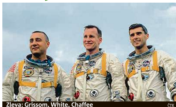
Zleva: Grissom, White, Chaffee

Firma North American údajně získala mnohamiliardový kontrakt na vývoj a výro-