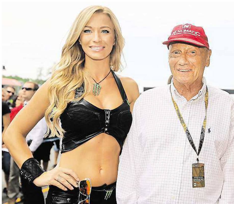
Na Masarykův okruh v loňském roce zavítal také bývalý slavný pilot F1 Niki Lauda.