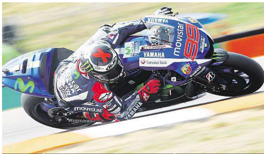
Velkou cenu České republiky v kategorii MotoGP loni ovládl Španěl Jorge Lorenzo.