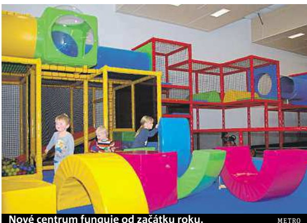
Nové centrum funguje od začátku roku.

„Když jsem se o Šaškárně doslechla poprvé, měla jsem obavy, že na takovém prostoru moje čtyřletá dcera brzy nebude mít co dělat, ale zkusily jsme to a realita byla úplně jiná. Dnes jsme tu během čtrnácti dní už potřeť,“ usmívá se spokojená maminka Alena