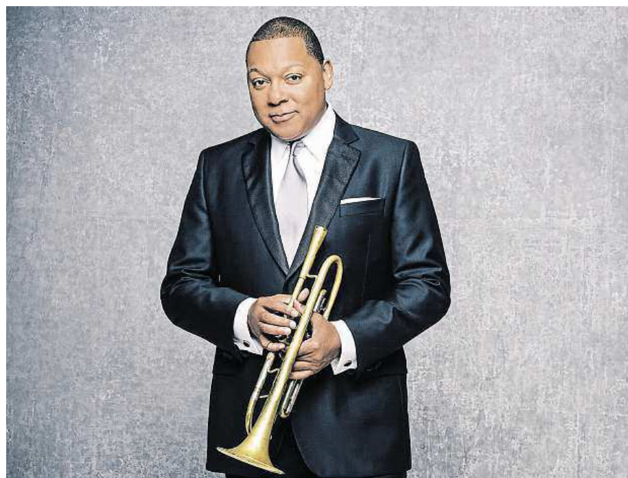
Wynton Marsalis, nejznámější jazzman 80. let minulého století