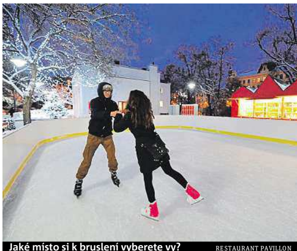
Jaké místo si k bruslení vyberete vy?

Jelikož nákladní automobily se stavebním materiálem využívají stejnou příjezdovou cestu jako dříve bruslaři ke kluzišti, nemohl být z bezpečnostních důvodů provoz areálu spuštěn. „Je to velká škoda. Kluziště na Vodově bylo v Brně nejlepší. Byla tam skvělá atmosféra a i při větším množství lidí měl každý brus-