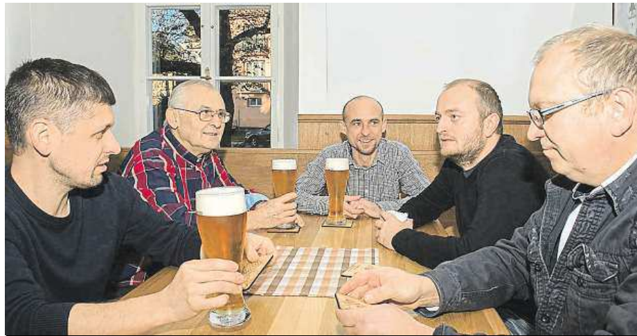
Ochutnávka první várky nového tišnovského piva