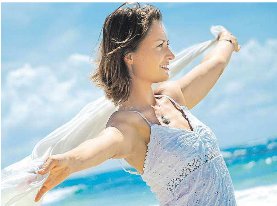
Jednou z rad Husarové je najít nový směr díky změně myšlení.

„Stačí jen věřit, dělat pro to maximum a žádat okolí o pomoc. Jak říká moje oblíbené přísloví: Žádej a bude ti dáno,“ začíná své vyprávění lektorka osobnostního rozvoje. Při natáčení menšího dokumentu se setkala s producentem a ten jí navrhl vytvoření rozsáhlejšího projektu.