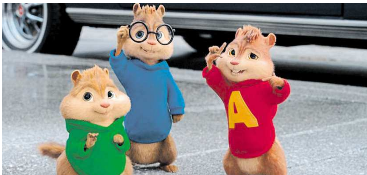
Veverky Alvin, Simon a Theodore se vrací. Film Alvin a Chipmunkové: Čiperná jízda jde do kin již zítra.

Brno. Potřebuje padesát nových mužů v uniformě. Problém. Zájemců je hodně, jen málokdo však projde psychotesty a zkouškami tělesné zdatnosti. Motivace. Každý nový strážník dostane třicet tisíc korun STRANA 6