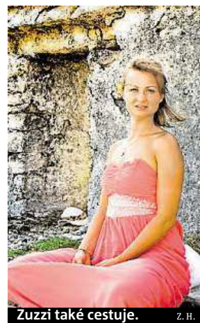
Zuzzi také cestuje.