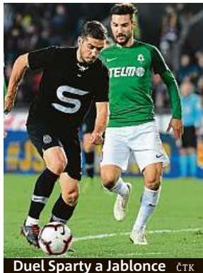
Duel Sparty a Jablonce