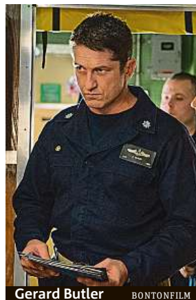
Gerard Butler

Byla to jedna z nejlepších zkušeností, kterou jsem kdy s jakýmkoli hercem měl. Miluju práci se skandinávskými herci, jsou tak cool. To není o egu. Pracují a přesto jsou tak hraví zkoušejí nové věci, nebojí se riskovat. Líbil se mi náš vztah ve filmu, jak inspiroval ostatní herce. Když pracujete s mladými kolegy a je