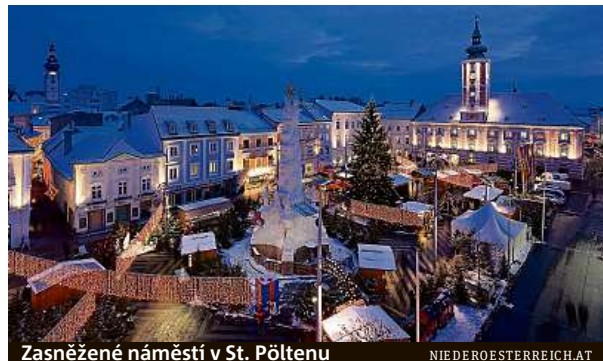
Zasněžené náměstí v St. Pöltenu

Omamná vůně svařeného vína, čerstvých sušenek a výhled na zamrzlé vinice z horké vířivky, tak může vypadat předvánoční romantický výlet do dolnorakouského Wachau. Den můžete strávit procházkou po ojíněných vinicích nebo v teple u krbu v hotelu či ve spa. Večer se pak rozzáří tisíce světel na adventním trhu kolem zámku Dürnstein. Za návštěvu stojí i adventní vesnička v Melku. Podunají nabízí i trhy s kulisou romantických hradů a zámků. Tisíce světlýlek ozáří zříceninu Aggstein, nádvoří zámku Eckartsau a Hof, kde probíhají vánoční prohlídky.