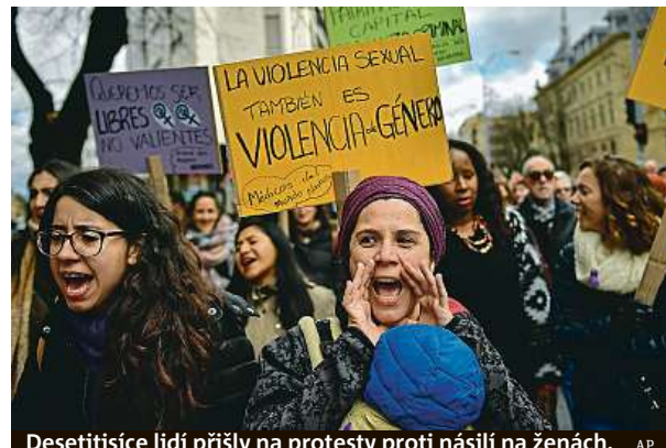
Desetitisíce lidí přišly na protesty proti násilí na ženách.

Boj proti násilí na ženách představuje ve Španělsku národní úsilí, napsala agentura AFP. Od roku 2003 zde podle oficiálních čísel nejméně 972 žen zabili jejich partneři či bývalí partneři. Poté, co několik verdiktů nad pachatelé se-