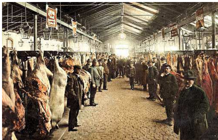
Holešovická jatka v roce 1905. Dnes slouží trhům a kultuře.

Procházku dávno zmizelými ulicemi, seznámení s historií holešovického průmyslu, železniční a lodní dopravy, ale i se všedním životem zdejších obyvatel nabídne nová výstava v hlavní budově Muzea hlavního města Prahy na Florenci.