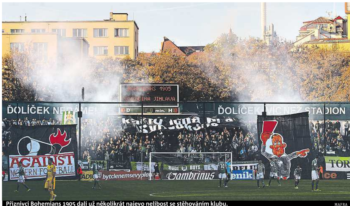
Příznivci Bohemians 1905 dali už několikrát najevo nelibost se stěhováním klubu.