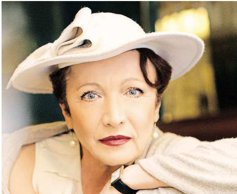
Hana Maciuchová bude hlavní hvězdou zahájení předvánočních oslav v metropoli.