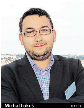
Michal Lukeš MAFRA

Máme vysoutěženou firmu a čekáme na rozhodnutí Úřadu pro ochranu hospodářské soutěže, kde leží dvě stížnosti na tendr. Doufáme, že roz-