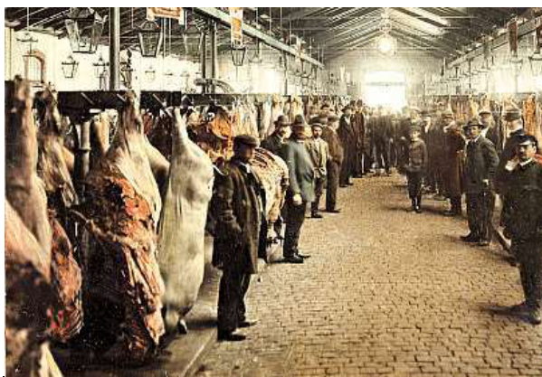
Holešovická jatka v roce 1905.