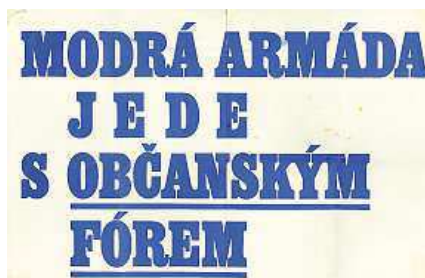
Plakáty byly dílem profesionálů i amatérů.