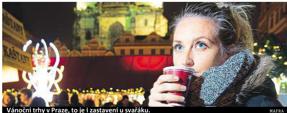
Vánoční trhy v Praze, to je i zastavení u svařáku.