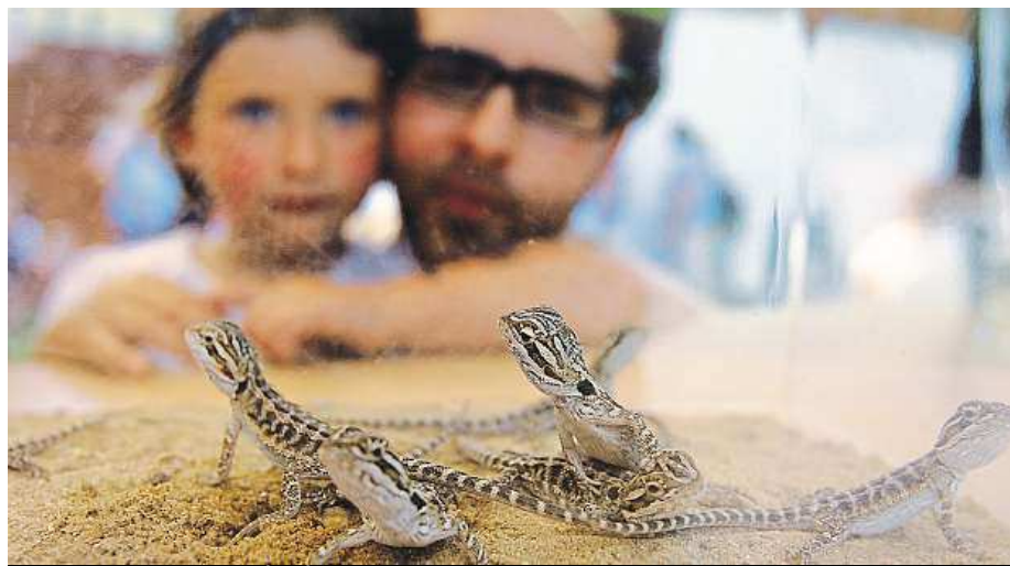
Ve Stanici přírodovědců můžete pozorovat roztomilé agamy vousaté.

Mořské živočichy si mohou děti prohlédnout v Mořském světě v Holešovicích, jehož dominantou je obří nádrž se sladkovodními živočichy. V horním patře se nachází dvacet pět metrů dlouhá jeskyně s akvárii zabudovanými v umělé skalní stěně. Celé patro je věnováno korálovým útesům a jejich životu. Interiér Mořského světa zdobí nástěnné malby velkých rozměrů. Děti se mohou také zúčastnit některé z pravidelných akcí, například krmení živočichů, či navštívit takzvanou vesmírnou lagunu, tedy