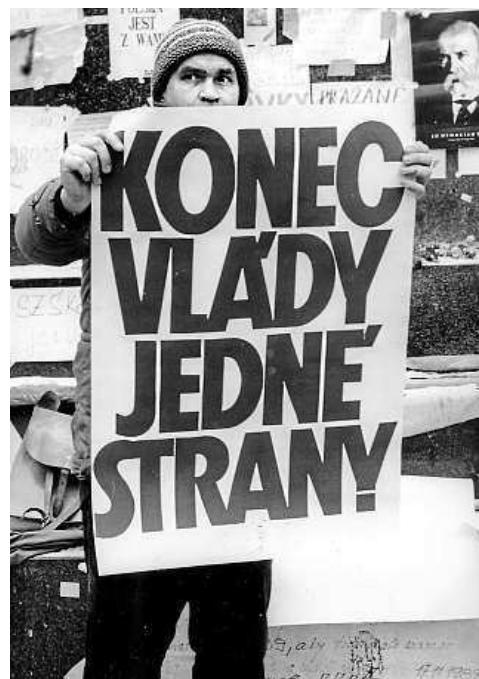
3X MUZEUM HL. M. PRAHY