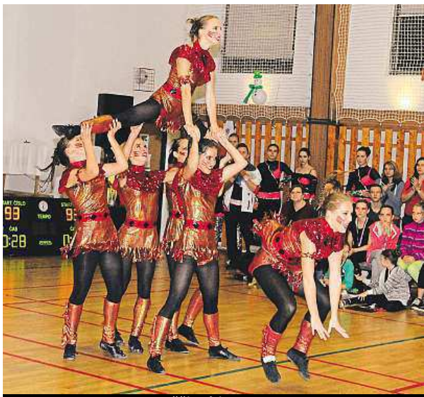
Formace Kappa na soutěži White Cup 2014 ODDÍL RNR ALFA

„Je to velice kreativní a především náročný sport. Spojuje krásu a eleganci tance a napětí akrobatických prvků spojených s divokým rytmem. Po-