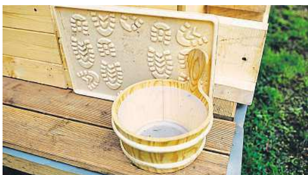
Sauna je plně vybavená vším potřebným.

Netradiční způsob relaxace byl ještě začátkem roku zcela zdarma. Na novém místě si však už za posezení v teplíčku zaplatíte. „Sauna byla zdarma během zimního provozu, kdy byl provoz dotován z grantu, který na projekt obdrželo naše sdružení. Během provozu v KC Klubovna vybíráme poplatek sedmdesát korun za jednu saunovací etapu, a to bez ohledu na to, kolik lidí ji najednou využívá. Jde o částku, která by měla pokrýt náklady na elektřinu, vodu a úklid,“ zdůvodňuje