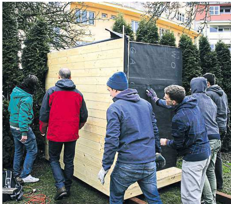
Komunitní sauna ještě na svém starém místě v Dejvicích (vlevo). Na jejím sestavení se podílejí výhradně dobrovolníci.