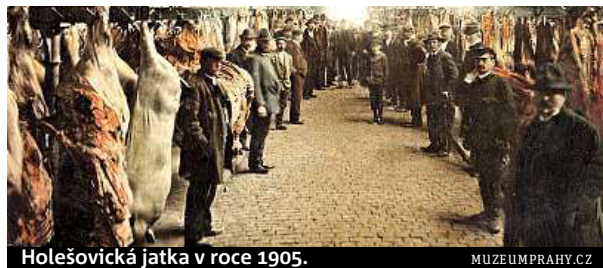
Holešovická jatka v roce 1905.