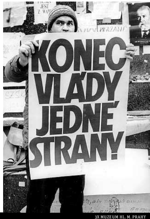
3X MUZEUM HL. M. PRAHY