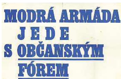
Plakáty byly dílem profesionálů i amatérů.