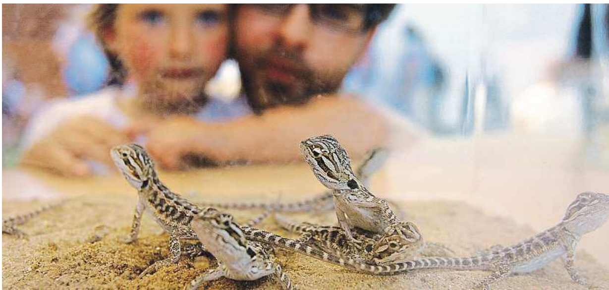
Ve Stanici přírodovědců můžete pozorovat roztomilé agamy vousaté.