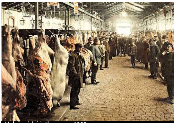
Holešovická jatka v roce 1905.