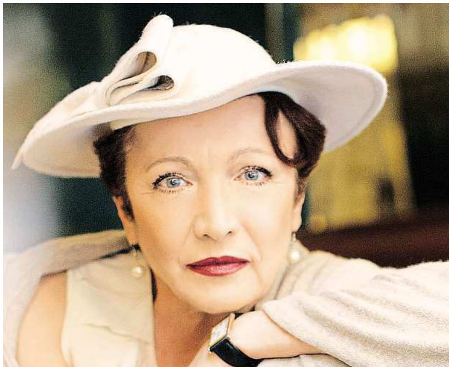
Hana Maciuchová bude hlavní hvězdou zahájení předvánočních oslav v metropoli.