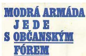
Plakáty byly dílem profesionálů i amatérů.