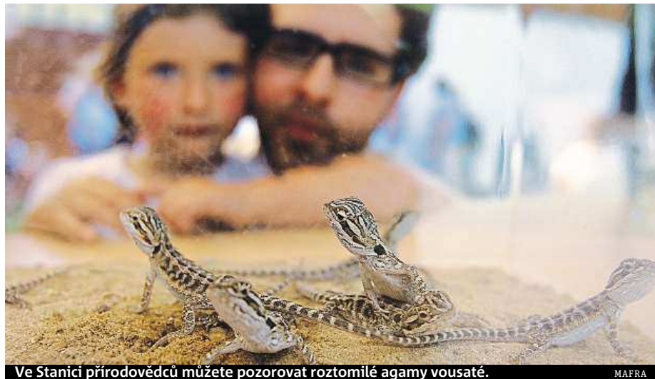
Ve Stanici přírodovědců můžete pozorovat roztomilé agamy vousaté.

Mořské živočichy si mohou děti prohlédnout v Mořském světě v Holešovicích, jehož dominantou je obří nádrž se sladkovodními živočichy. V horním patře se nachází dvacet pět metrů dlouhá jeskyně s akvárii zabudovanými v umělé skalní stěně. Celé patro je věnováno korálovým útesům a jejich životu. Interiér Mořského světa zdobí nástěnné malby velkých rozměrů. Děti se mohou také zúčastnit některé z pravidelných akcí, například krmení živočichů, či navštívit takzvanou vesmírnou lagunu, tedy