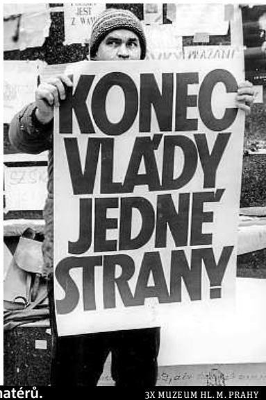
3X MUZEUM HL. M. PRAHY

Průběh sametové revoluce v ulicích metropole dokumentuje neobvyklá výstava.