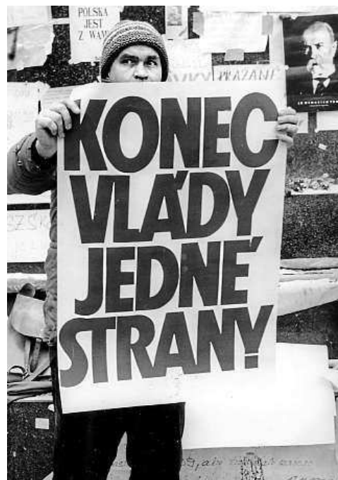
Plakáty byly dílem profesionálů i amatérů a bylo jich plné město.