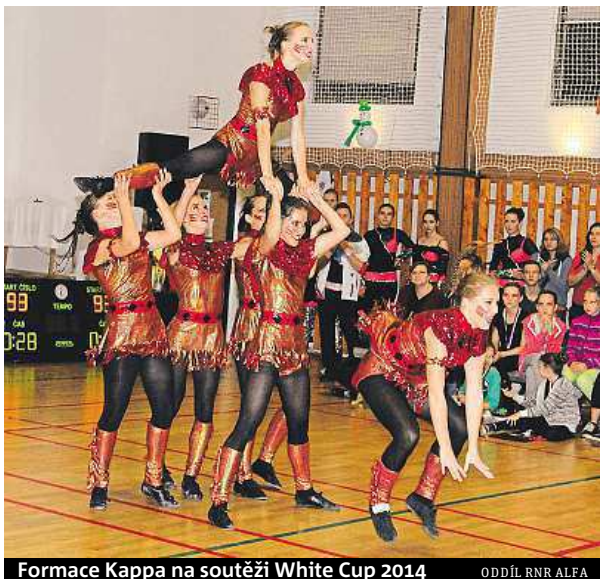
Formace Kappa na soutěži White Cup 2014 ODDÍL RNR ALFA

„Je to velice kreativní a především náročný sport. Spojuje krásu a eleganci tance a napětí akrobatických prvků spojených s divokým rytmem. Po-