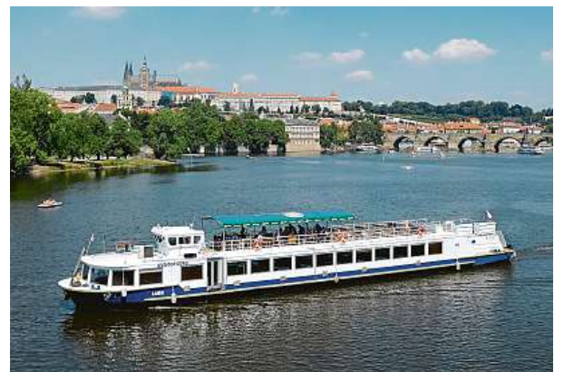
Motorová osobní loď Labe