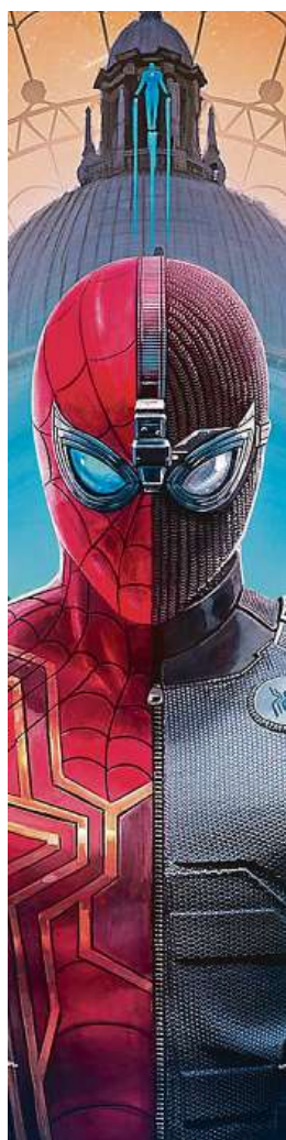
Fanouři přijdou i o některé filmy se Spider-Manem.