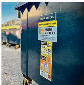
Multikomoditní sběr v praxi PS

Třídění v Praze prochází největší revolucí od svého zavedení. Změna má metropoli ušetřit miliony a lidem usnadnit recyklaci. „Zatím eviduje-