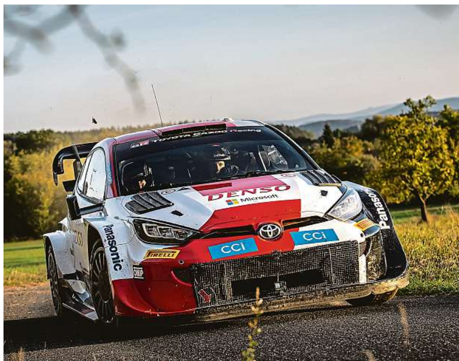
Ceremoniální start prvního ročníku Central European Rally proběhne přímo na Hradčanském náměstí.