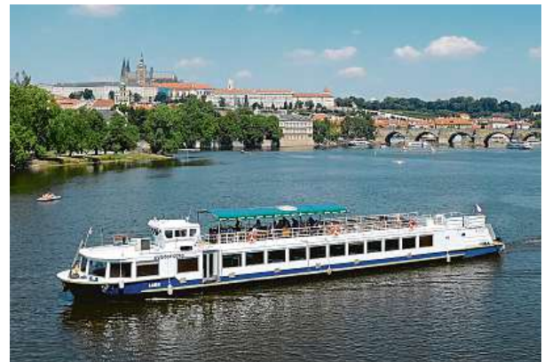
Motorová osobní loď Labe