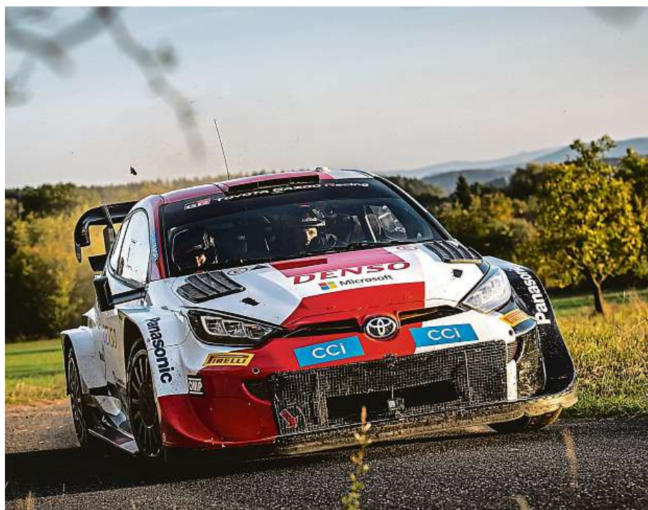
Ceremoniální start prvního ročníku Central European Rally proběhne přímo na Hradčanském náměstí.