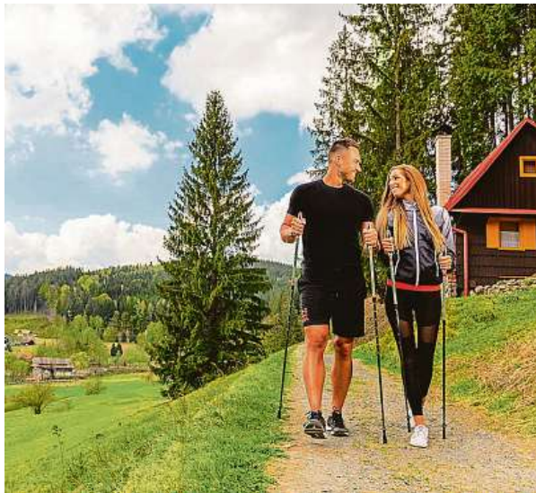
Výlet v chráněné krajinné oblasti Beskydy

Představte si jeden den, kdy nemáte na práci nic jiného než si pořádně odpočinout. Jeden den, kdy se můžete dosytosti koupat v termálním bazénu, nahřívát se v sauně, dopřát si masáž