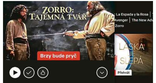
Sledujte, než to smažou! Vtipná hláška se stává realitou.

Pokud vám tento důvod připadá pochybný, vezte, že tuhle praxi začínají aplikovat