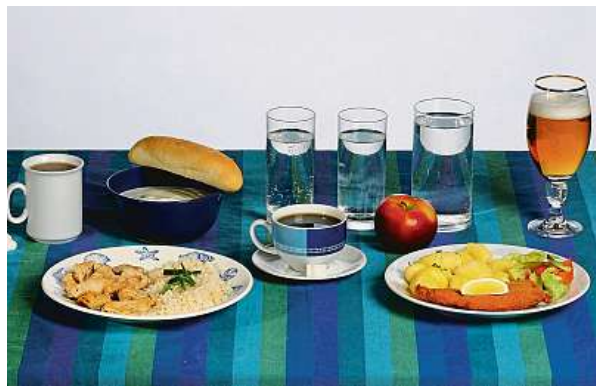
Pivo jako nápoj k obědu už moc neletí. Podle Barometru FOOD si ho dává menšina respondentů, a spíše malé než velké.

To znamená, že pokud některý z členů vlády má možnost najíst se po ránu z vládních zásob, spadá podle vý-