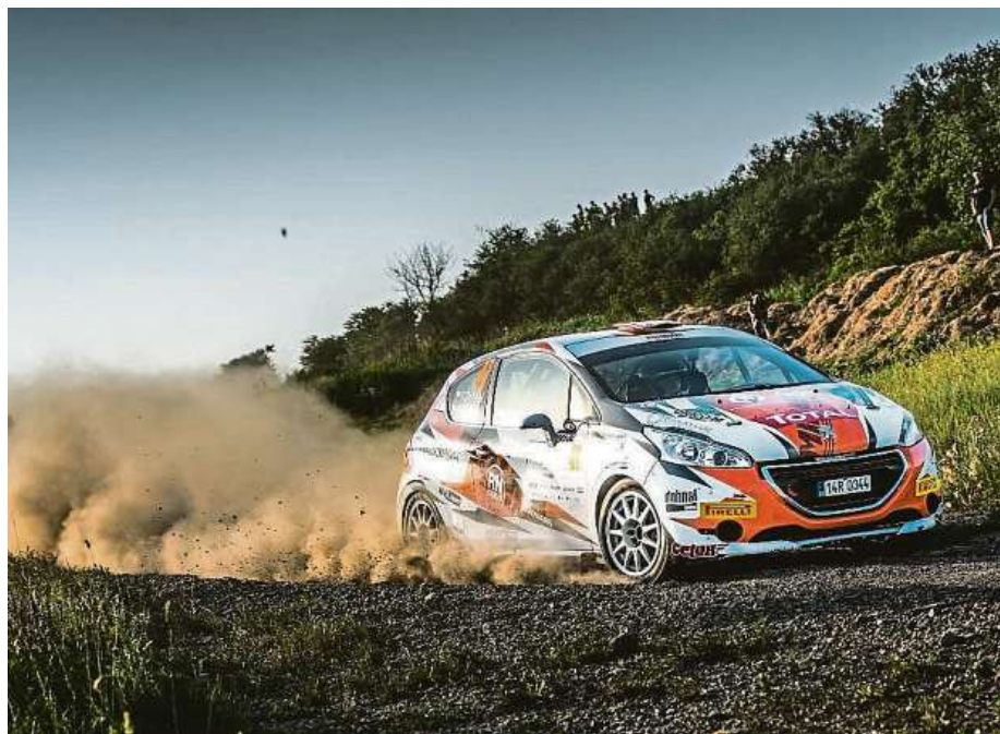
První posádky odstartuje prezident České republiky Petr Pavel, mezi dalšími hosty bude předseda vlády Petr Fiala, v cíli ocení nejlepší posádky bavorský premiér Markus Söder.

Oficiální předprodej vstupenek již skončil, ale na jednotlivých rychlostních zkouškách bude možné zakoupit jednorázové vstupy, avšak pouze v hotovosti. „Bylo by složité na tolika místech zřizovat platební terminály,“ vysvětluje Koudelka. Podle něj pořadatelé očekávají velkou návštěvnost, právě díky tomu, že jsou v Česku automobilové soutěže populární. Podle pořadatelů si akci nene-