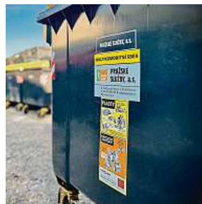
Multikomoditní sběr v praxi PS

Třídění v Praze prochází největší revolucí od svého zavedení. Změna má metropoli ušetřit miliony a lidem usnadnit recyklaci. „Zatím eviduje-