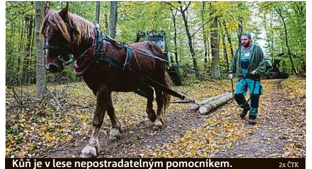
Kůň je v lese nepostradatelným pomocníkem.

Kůrovcová kalamita v Česku už kulminovala a loni a letos se dařilo postup kůrovce brzdit. Situaci pomohlo jak