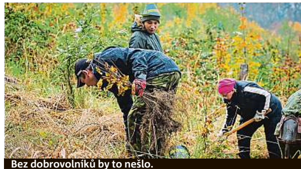
Bez dobrovolníků by to nešlo.

Den za obnovu lesa se konal v každém z krajů Česka