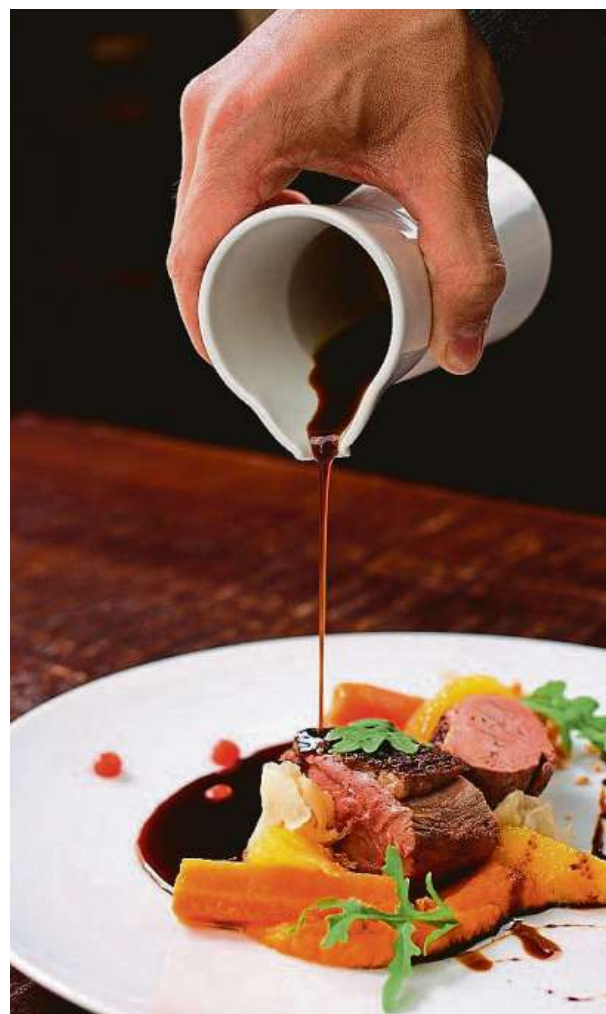
Ve vítězném Kohoutovi na víně si můžete dát i kachnu. KNY

• Pivnice a pivovary: Vorkloster, Předklášteří