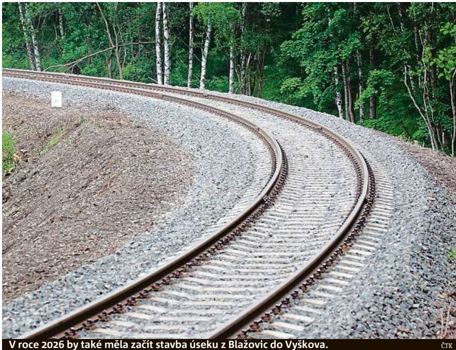
V roce 2026 by také měla začít stavba úseku z Blažovic do Vyškova.

Pro úsek z Nezamyslic do Kojetína už je vydané územní rozhodnutí a projektanti pracují na dokumentaci pro stavební povolení. Pro úsek z Kojetína do Přerova se očekává v nejbližší době vydání územního rozhodnutí a připravuje se zadávací řízení na projekční kancelář, která zpracuje dokumentaci pro stavební povolení. Úsek z Nezamyslic do Přerova také při přestavbě projde konverzí ze stejnosměrné napájecí proudové soustavy na střídavou. Na celé trati také bude fungovat zabezpečení pomocí systému ETCS, který umožňuje zastavit vlak na dálku.