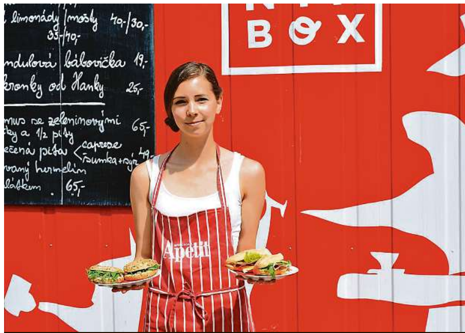
V nové kategorii S sebou bodoval i Piknik Box.