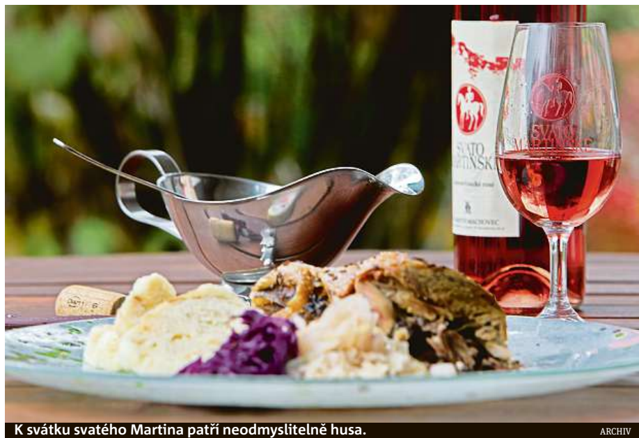
K svátku svatého Martina patří neodmyslitelně husa.

dá očekávat, že vzhledem k příznivému průběhu sezony budou lehčí s nižším obsahem alkoholu. Červená budou díky teplému srpnu měkká, sametová, velmi příjemně pitelná. Bílá a růžová vína pak budou mít jemnější kyselinku než v loňském roce a budou doplněna lehkou ovocností,“ předpovídá Marek Babisz z Národního vinařského centra, které hodnocení zajišťuje. Podle předběžných ohlasů vinařů a díky přejícímu průběhu sezony předpokládá, že by na trh mohlo zamířit kolem 2 300 000 svatomartinských vín ročníku 2022. Všem akcím a oslavám dominuje právě Svatomartinský košt na brněnském náměstí Svobody. Tento tradičně nabídné 100 vzorků svatomartinských vín od desítek vinařů. RADEK BABIČKA