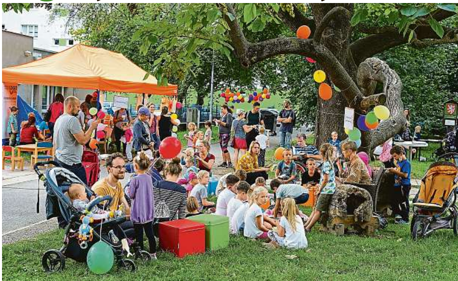
Akci pro veřejnost je například autorské čtení.

Poradkyně jezdí přímo domů k rodičům dítěte