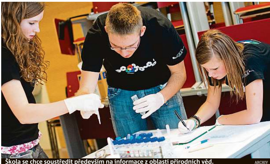
Škola se chce soustředit především na informace z oblasti přírodních věd.

Jeho sídlem se stane budova bývalé obchodní akademie na Pionýrské ulici a mělo by nabídnout špičkové všeobecné střední vzdělání s důrazem na přírodní vědy, které jsou významným prvkem vzdělávací a inovační strategie celého regionu. Navíc je poptává široké spektrum fi-