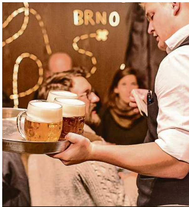
Kategorií pivnic opanoval Lokál u Caipla.