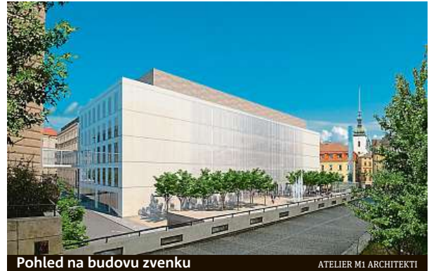
Pohled na budovu zvenku