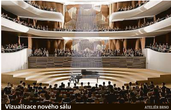
Vizualizace nového sálu

Letos je tomu přesně 20 let, co byla vypsána architektonická soutěž na podobu Janáčkova kulturního centra. Nyní město zahájilo hledání stavitele.